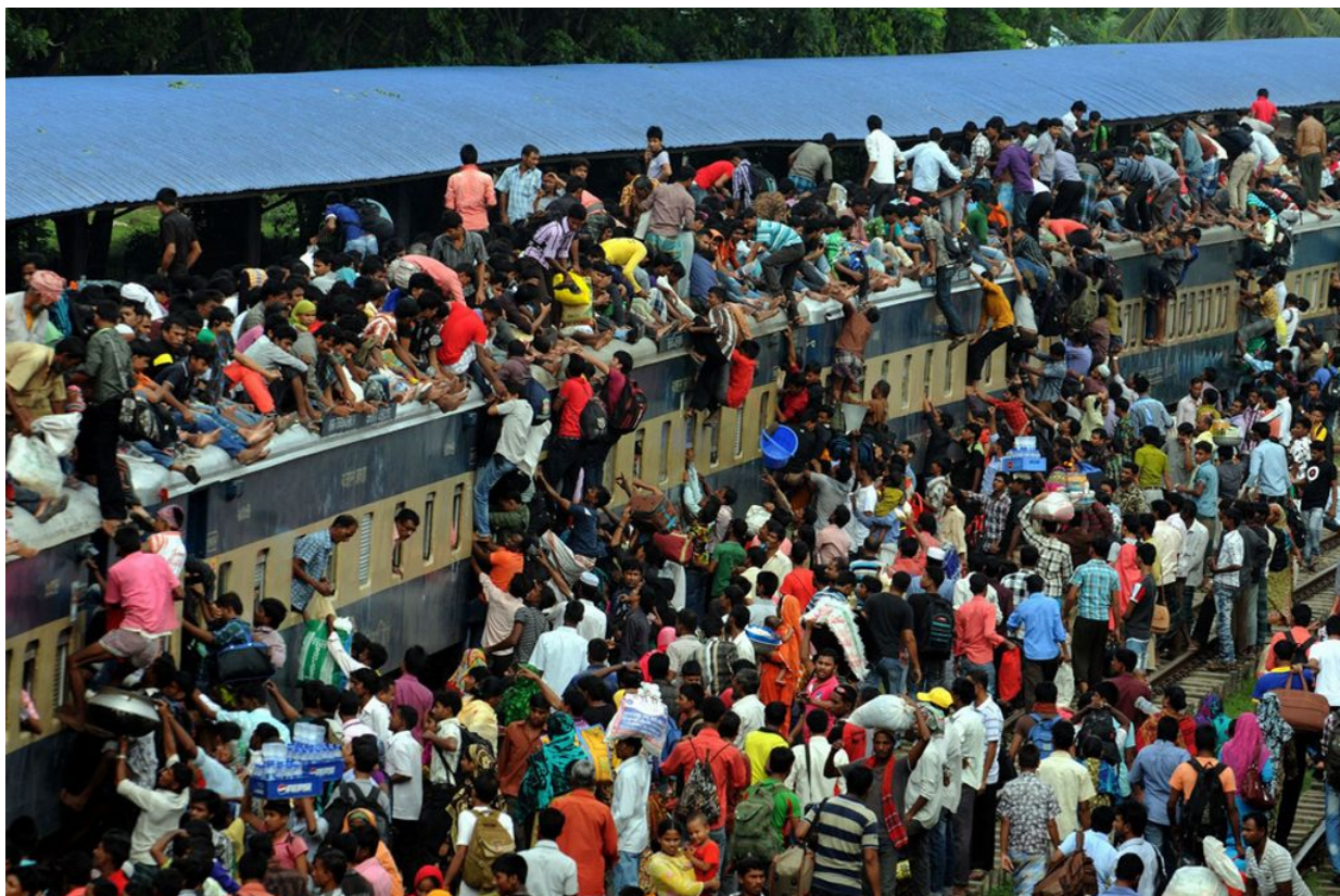
Nádraží v Indii.

Společnost Gro Intelligence uvedla varovnou studii [3], že již za 10 let bude ve světě chybět 214 bilionů kalorií pro výživu světové populace. To odpovídá 379 miliardám hamburgerů Big Mac, které řetězec McDonald's nevyrobil ani za celou historii své existence. Oficiální předchozí studie OSN přitom hovořila o tom, že tato krize nastane až v roce 2050. To znamená, že proces přelidnění planety se urychlil. Calhounův experiment nám ukázal, co se stane, když myš ztratí životní prostor. Volných pozemků, kde můžete v ČR postavit dům, rapidně ubývá. V Celé Evropě. Není se kam pohnout. Všechny pozemky už někdo vlastní. Jsou tedy sociálně definovány. Nemůžete jít bydlet na cizí pozemek (pokud nejste migrant, ti jsou chráněni, plní úlohu úpadku západní civilizace a jejího programového zchudnutí). Takže přelidnění nerovná se počet lidí, ale rovná se nedostatku životního prostoru, který byl spouštěčem katastrofálního konce kolonie myši v Calhounově experimentu. Tento článek nemá za úkol plivat na člověka, že je myš. Ne, člověk není myš, člověk má 14% genů navíc, které ho od myši odlišují. Ale to, co máme s myší společné, to je více