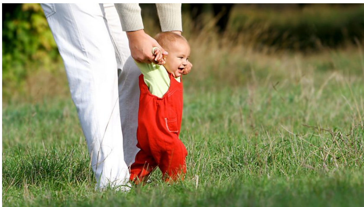
Rodič učí dítě chodit ve vzpřímené poloze.

Co však u člověka zůstává stejné jako u myši, to je základní biologické vybava a instinkty. Chování člověka jako jedince odpovídá chování jedné myši. Interakce dvou myši vede k vytvoření páru, jako u lidí. Při dosažení určitého vysokého počtu lidí vzniká u skupiny obyvatelstva davový jev, stejně jako u myši. A stejně jako u myši, blahobyt vede k degeneraci a zániku vlastní rasy. Rozdíl je v tom, že člověk je mnohem mocnější než myš a disponuje větším mozkiem, který umožňuje člověku plánování a abstraktní myšlení. Růstové komplexní hormony, které myši nemají, během 18 až 20 let způsobí, že z malého kojence vyroste téměř 2 metry vysoká bytost, která se ve věku batolete naučila chodit po zadních, ve vzpřímené poloze, k čemuž dítě naučil a de facto donutil rodič. Vezme dítě za ruce, postaví kojence na nohy a učí kojence chodit. Cílem je vymazat dítěti z mozku zbytky zvířecího návyku na běh po 4 končetinách.