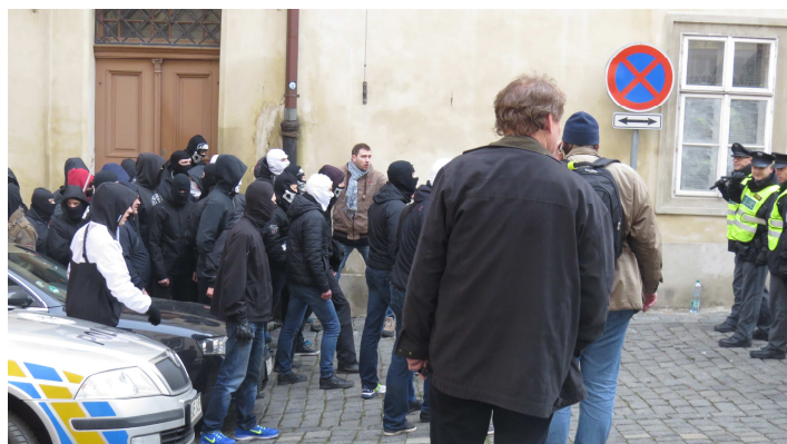
Incident v Thunovské ulici, Praha 6. 2. V pozadí kriminalista („muž v hnědé bundě“).

Největším prostorem pro nenávistná vyjádření byl internet . Často ovšem byly autory těchto výroků osoby, které nejsou pravicovými extremisty.