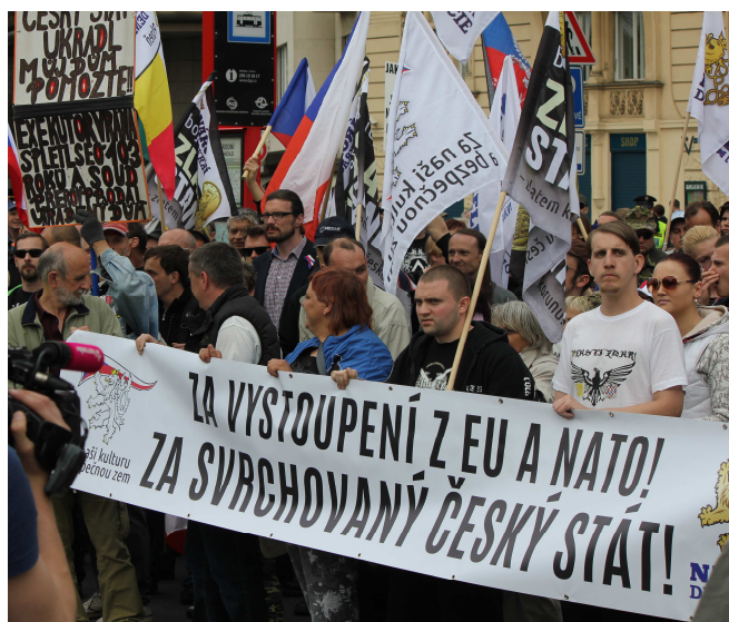
Prvomájová akce ND v Praze zaměřená "proti vlastizrádcům"

Při zadržení napadla část účastníků zasahující policisty a byly zadrženy další 4 osoby.