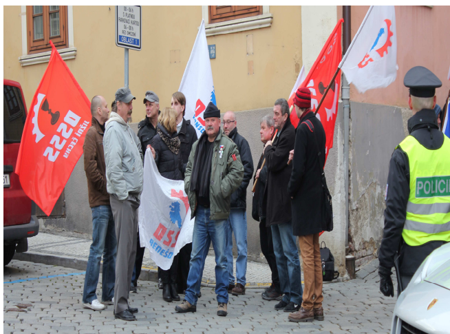
Průznivci DSSS vyjadřují podporu německé NPD, Praha 27. 2.

DSSS se realizovala v rámci svých mezinárodních vztahů a partnerství . Zmínit lze zejména členství v již zmíněné Alianci pro mír a svobodu , spolupráci s Národně demokratickou stranou Německa (Nationaldemokratische Partei Deutschlands) či Ľudovou stranou Naše Slovensko Mariána Kotleby. Motivací pro členství v Alianci pro mír a svobodu byl bezesporu i záměr získat část finančních prostředků, které si tento ultranacionalistický projekt nárokuje od Evropské unie.