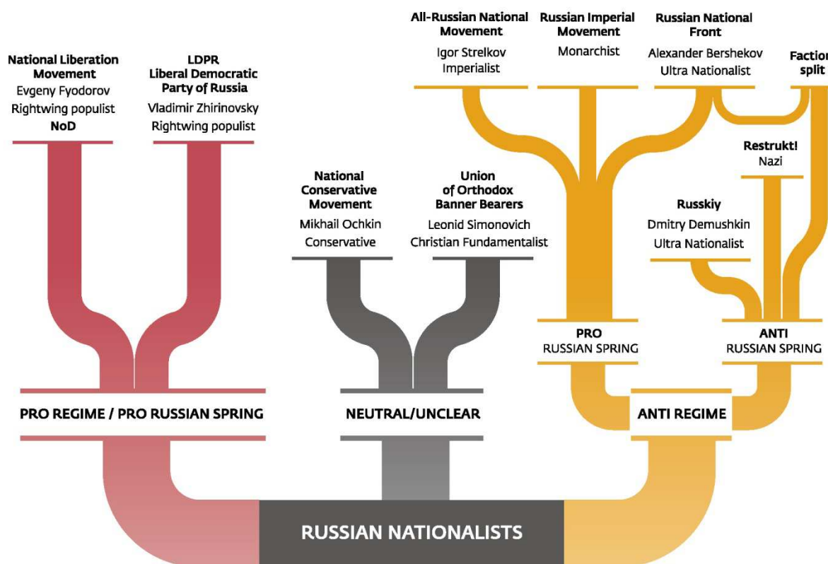
Symbolické naznačení jednotlivých směrů ruské krajní pravice

V Rusku nadále přetrvávalo rozdělení extrémní pravice na pro-putinovskou a proti-putinovskou část. Pravicoví extrémisté zorganizovali 4. listopadu v několika městech tradiční Ruský pochod. V Moskvě na něm jeden z účastníků nesl i českou vlajku. Jednalo se o vyjádření solidarity mezi slovanskými národy, další účastníci nesli vlajky dalších států s dominujícím slovanským obyvatelstvem. V Rusku se pak i v roce 2016 uskutečnila řada násilných aktů proti přistěhovalcům spáchaných příslušníky různých proudů extrémní pravice.