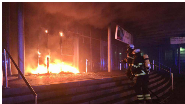
Zásah hasičů v „Hamburg Messe“, místě konání summitu zemí skupiny G-20 v roce 2017, po útoku německých anarchistů

V souvislosti s německým anarchistickým prostředím je nutno také zmínit listopadové vytvoření iniciativy proti setkání představitelů skupiny G-20 , které se má konat v červenci roku 2017 v Hamburku, a to pod hesly: „útoč na summit G-20“, „uvrhní Hamburk do chaosu“ nebo „znič evropskou pevnost“. V rámci této kampaně bylo již v průběhu roku 2016 spácháno