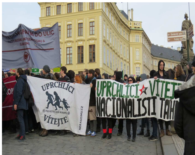
Protinacionalistická akce s účastí anarchistů, Praha 6.2.

V roce 2016 bylo zaznamenáno výrazné utlumení aktivit Sítě revolučních buněk .