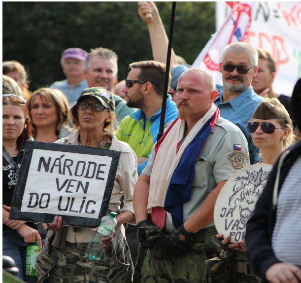
Domobranci na protiislámské demonstraci, Praha 28. 9.

zorganizovalo několik střeleb, určených pro stoupence a členy, které však doprovázela nízká účast okolo 20 osob.