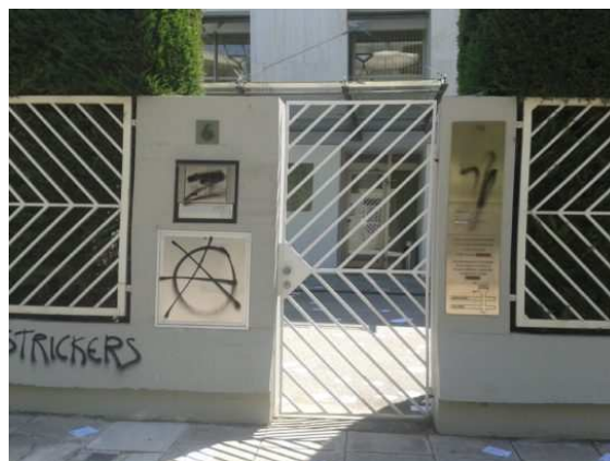
Česká ambasáda v Aténách po sprejerském útoku řeckých anarchistů