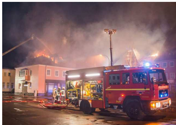
Hořící areál ubytovny pro uprchlíky v Budyšině

I v roce 2016 bylo téma vzestupu krajní pravice a množících se útoků vyvěrajících z ideologie pravicového extremismu diskutováno především v Německu . Takto opět byla zaznamenána gradace nenávislných projevů, včetně množství izolovaných útoků vůči cizincům, nevyjímaje úmyslné žhářské útoky na ubytovny pro přicházející migranty. Za příklad zvýšeného napětí v důsledku migrační krize může sloužit vyostřená situace ve východoněmeckém městě Budyšin