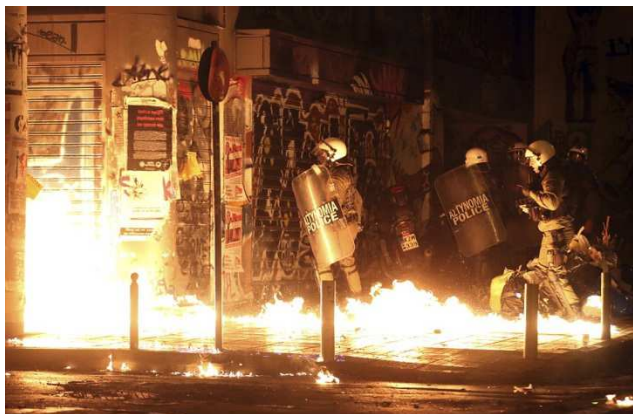
Násilnosti během listopadové návštěvy amerického prezidenta Obamy, na nichž ve značné míře participovaly anarchistické skupiny.

Podobně jako v předchozích letech bylo možno v Řecku zaznamenat též militantní demonstrace, při nichž docházelo k násilným střetům anarchistů s policisty. K vážnějším veřejným nepokojům došlo například opět 6. prosince u příležitosti výročí smrti Alexise Grigoropoulose (mladíka zabitého v roce 2008 policií). 10 V reakci na vzetí do vazby tří osob, které policie podezírala z účasti na násilných střetech při zmiňované demonstraci, anarchisté následně zničili tři trolejbusy aténské dopravy (nejprve tyto autobusy zastavili, poté nechali vystoupit cestující a nakonec je zapálili).