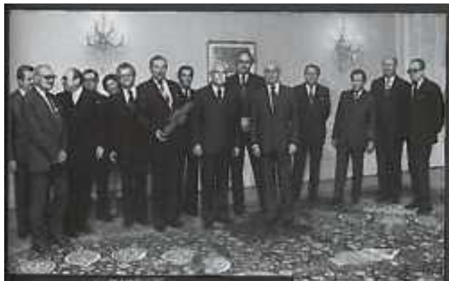
Nejvyšší představitelé strany a státu počátkem 80. let