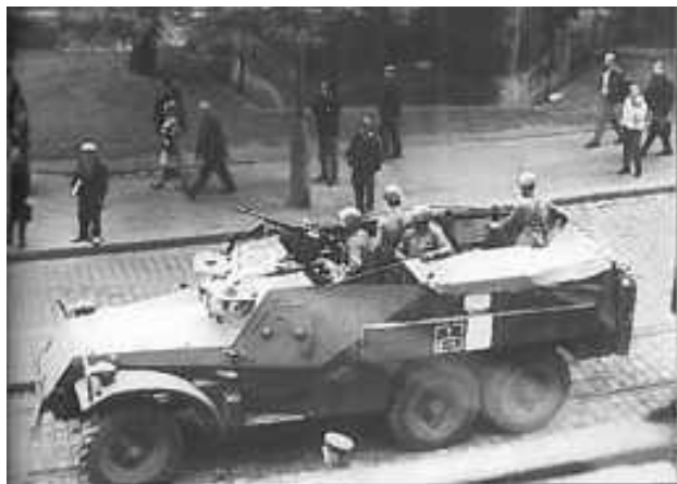
Už 22. srpna 1968 dostal Vasil Biľak cejch kolaboranta.