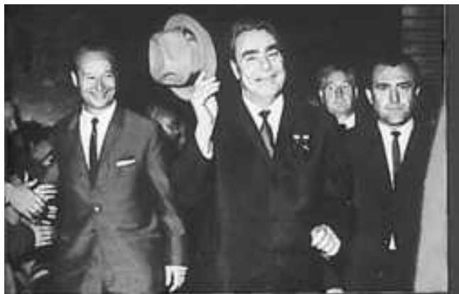
Během bratislavské schůzky, krátce před 21. srpнем 1968 ve společnosti Alexandra Dubčeka a Leonida Brežněva