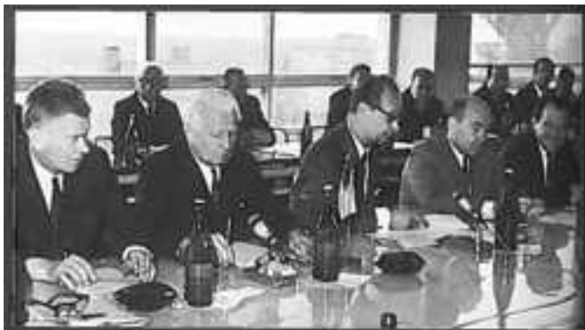
Pětice mužů, která v roce 1988 hrála v politickém životě vůdčí roli. Zleva: J. Smrkovský, L. Svoboda, A. Dubček, O. Černík a ... Vasil Biřák

Pozval nebo nepozval sovětské tanky do republiky? Z jeho dodatku k pamětnímu, které učinil jako důstojník po roce 1989 vyplývá, že o připravované invazi nejen věděl, ale snažil se ji i legitimizovat