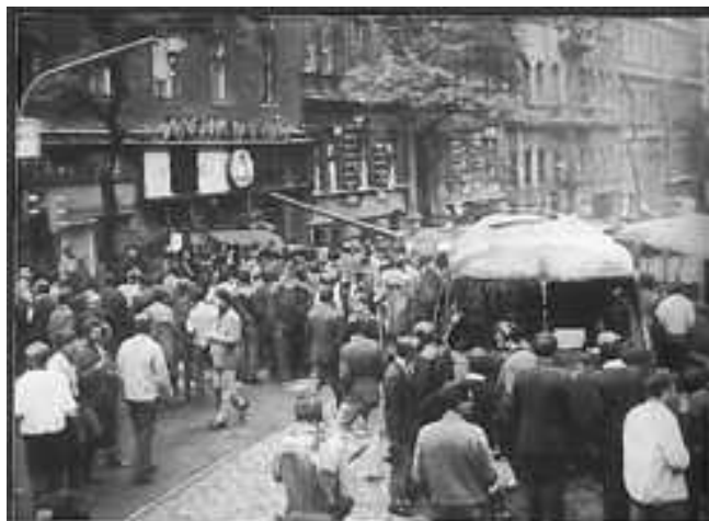
Barikáda na Vinohradské třídě v Praze před Československým rozstátem.