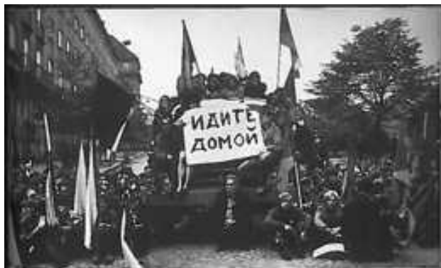
Vzduť lidé staseli barikady... Idete domoj