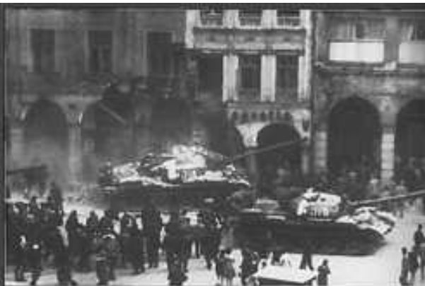
...sovětské tanky v ulicích. Lidé měli snahu se domluvit...