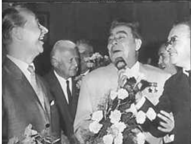
Alexander Dubček, gen. Ludvík Svoboda a Leonid Brežněv ve společném rozpoložení