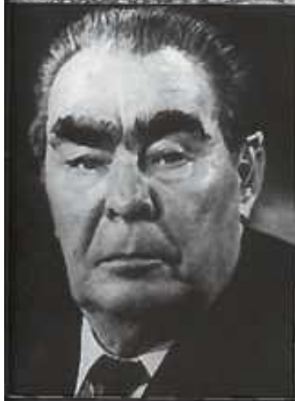
Leonid Brežněv, věrný štábní ochránce, nedlouho před svou smrtí v roce 1982