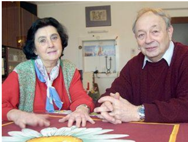
Zbyněk Čeřovský s manželkou

Zbyněk Čeřovský, politický vězeň a signatář Charty 77 od března 1977