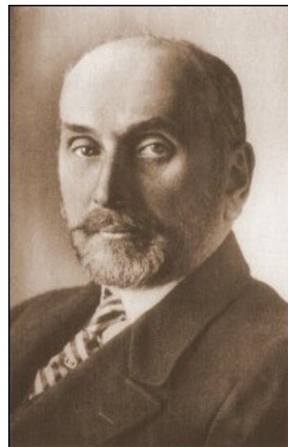
Sergej Dmitrijevič Sazonov

A tak čekal. 23. července mu rakouský velvyslanec v Srbsku dal to, co chtěl. Ne náhodou vídeňští diplomaté předložili Srbsku ultimátum, jakmile se Pointcaré vrátil do Paříže – neboť takto francouzský a ruský vůdce nemohli naplánovat reakci. To Rakušanům a Němcům vyhovovalo. Pro naše „spojence“ to mělo jinou důležitost – po odjezdu francouzský prezident nemusel odpovídat na specifické otázky Nikolaje II, a místo toho mohl prostě „poslat telegram“. Nedej bůh, aby ruský car skutečně navrhl přijít s nějakým dalším společným prohlášením, například postupovat podle požadavků Rakouska a vytvořit nějaký mezinárodní výbor. To by dlouho očekávanou válku zpozdilo. Tudíž místo konkrétní diskuse o stále komplexnější situaci mohly Francouzům projít otřepané fráze. A časový limit ultimáta byl pouhých 48 hodin! Čas běží tak rychle, že již bylo pozdě zastavit válku! Hlavním Greyovým cílem pak bylo učinit věci nezvratnými.