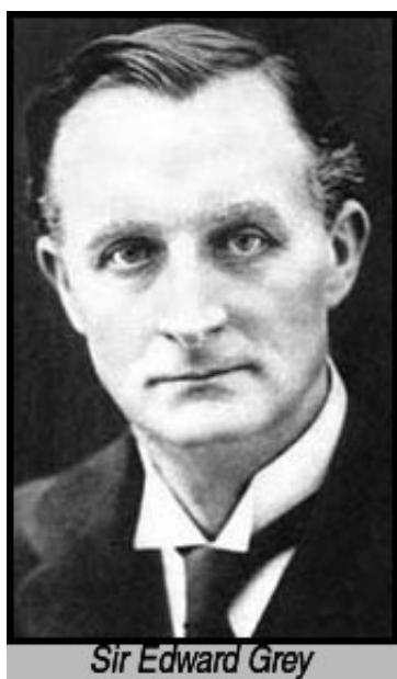
Sir Edward Grey

Takto se staré anglické soukromé vládě opětovně podařilo přinést do Evropy masakr... -- Alfred von Tirpitz, německý veloadmirál