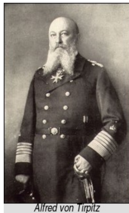
Alfred von Tirpitz

Místo toho „nezávislý“ britský tisk začal uveřejňovat články, které by jinak byly označeny za provokace, ale samozřejmě, že byly považovány za normální. Standard a Daily Chronicle výslovně uvedly viníky ze smrti rakouského dědice: „Není pochyb, že celá konspirace byla připravena v Srbsku, a část – ne celá – zodpovědnosti leží na Rusku“, „Vražda je klíčovým nástrojem Ruska při odstraňování všech svých nepohodlných nepřátel na Balkáně“. Fascinující je, jak ruští revolucionáři přilávali olej do ohně. Lev Davidovič Trocký, ve své knize „Evropa ve válce“, uvedl: „Vražda... byla bezpochyby zosnována srbskou vládou. Na druhou stranu Rusko bylo do příprav této vraždy zapojeno také, nepřímo.“