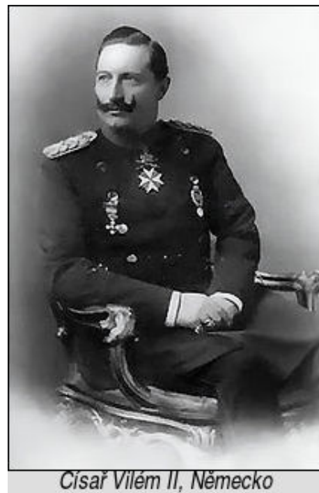
Císař Vilém II, Německo

Zjevnost tohoto potenciálního řetězce událostí byla hlavní zárukou, že k ozbrojenému konfliktu nedojde. První světové válce bylo možné snadno zabránit. Stačilo, aby Británie řekla Německu, že v případě války v Evropě nezůstane neutrální a postaví se na stranu svých spojenců z Trojspolku. Přesně takto Británie zabránila francouzsko-německé válce o několik let dříve, během marocké krize. Právě takováto akce byla potřeba, pokud chtěli londýnští gentlemani zachovat mír. Ale již v Maroku to bylo na efekt, návnada, jak zatáhnout Rusko do sítě Entente. Nyní to bylo zcela jiné: byly provedeny přípravy na zničení Ruska a Německa prostřednictvím nejstrašlivějšího představitelného vojenského konfliktu. Británie