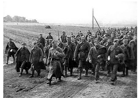
Důstojníci polské armády, kteří byli zajati sovětskou armádou

Katynský masakr je pojmenování masových vražd polských vojáků a civilistů během druhé světové války , spáchaných sovětskou tajnou službou (NKVD) a armádou. V Katyňském lese (nedaleko obce Katyň ) bylo začátkem roku 1940 NKVD popraveno asi 20 000 - 26 000 zajatých polských důstojníků , policistů, kněží a příslušníků inteligence , kteří byli odvedeni do SSSR během obsazení v Polsku. Tento válečný zločin je jednou z největších tragédií v novodobých dějinách Polska a stále zatěžuje polsko-ruské vztahy.