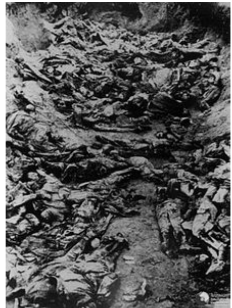
Pohled na exhumovaná těla největšího z hrobů v Katyni, rok 1943