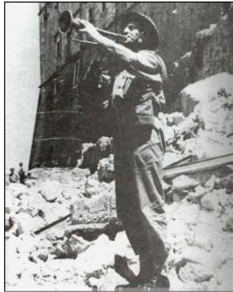
foto titulek, Polský trumpetista na dobytém Monte Cassinu

V červenci 1944 vstoupily polské jednotky jako první do Ancony a v dubnu 1945 do Boloně.