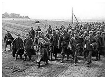
Polští vojáci zajatí Sověty během invaze do Polska

Poté, kdy nacistické Německo přepadlo 1. září 1939 Polsko a rozpoutalo tak druhou světovou válku v Evropě , se k jeho útoku v souladu s tajnými dohodami v rámci paktu Molotov–Ribbentrop připojil dne 17. září i Sovětský svaz . Ten následně získal kromě území a podrobeného obyvatelstva asi 15 000 válečných zajatců důstojnických hodností, k nimž připojil ještě asi 10 000 příslušníků inteligence (většinou rezervistů) zajatých mimo bojové operace. Tito všichni byli vězněni ve zcela nevyhovujících podmínkách v západním Rusku , Bělorusku a na Ukrajíně až do roku 1940, kdy vedení SSSR došlo na návrh šéfa NKVD Lavrentije Beriji k názoru, že není žádoucí, aby se „prominentní váleční zajatci“ obecně nepřátelsky smýšlející vůči SSSR a komunismu vůbec vrátili domů, a nechalo je povraždit. Jako důvod likvidace se v příkazu k ní výslovně udává právě jejich nepřátelský postoj k SSSR a jeho režimu.