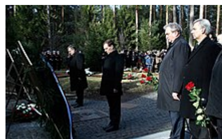
Ruský prezident Medveděv a polský prezident Bronisław Komorowski uctívají v dubnu 2011 památku obětí Katyňského masakru

Po vypuknutí Velké vlastenecké války se polská exilová vláda pokoušela vymoci propuštění svých Sovětským svazem vězňených občanů a vojáků včetně těchto povražděných, o nichž se domnívala, že ještě žijí (nebo v to alespoň doufala). Stalin tehdy tvrdil, že ve zmatcích na začátku bojů uprchli a on o nich nic neví [zdroj?] . V roce 1943 byly německou armádou u Katyně objeveny první masové hroby, do nichž byli zmasakrovaní zajatci pohřbeni. Německo se pokusilo celou věc