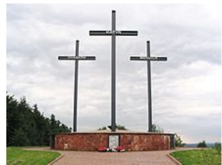
Památník Katyň-Charkov-Mednoje ve Svatokřížských horách , v Polsku

Katyňský masakr nebo Katyňský zločin (polsky zbrodnia katyńska ) je označení pro povraždění polských válečných i civilních zajatců vězněných v sovětských koncentračních táborech a táborech pro válečné zajatce, které provedla NKVD v roce 1940. Povražděno bylo přibližně 22 000 mužů – zejména důstojníků a příslušníků inteligence .