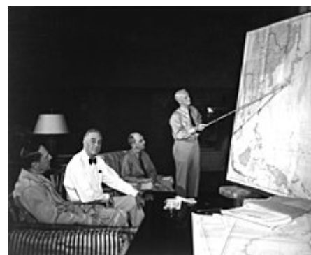
Nimitz, MacArthur a Leahy pořádají konferenci s FDR

Odpovědnost za plánování operace Downfall připadla americkým velitelům admirála flotily Chesteru Nimitzovi , armádnímu generálovi Douglasu MacArthurovi a sboru náčelníků štábů — admirálové flotily Ernestu Kingovi a Williamu D. Leahymu a generálům armády George Marshallovi a Hap Arnoldovi ( posledně jmenovaný je velitelem vzdušných sil americké armády ).