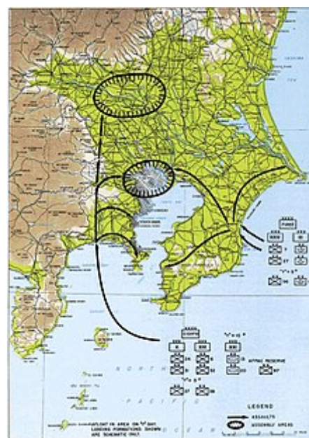
Operace Coronet byla plánována na dobytí Tokia.

Olympic měl být vybaven prostředky již přítomnými v Pacifiku, včetně Britské tichomořské flotily , formace Commonwealthu , která zahrnovala nejméně osmnáct letadlových lodí (poskytujících 25 % spojeneckého letectva) a čtyři bitevní lodě.