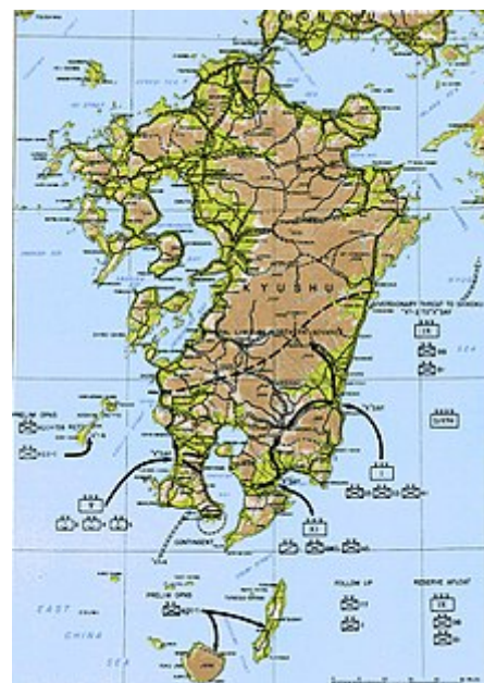
Operace Olympic byla plánována k útoku na jižní Japonsko.

Operace Olympic, invaze do Kyūshū, měla začít v „X-Day“, který byl naplánován na 1. listopadu 1945. Spojená spojenecká námořní armáda by byla největší, jaká kdy byla sestavena, včetně 42 letadlových lodí, 24 bitevních lodí a 400 torpédoborců a doprovod torpédoborců . Čtrnáct amerických divizí a „ekvivalent divize“ (dva plukovní bojové týmy ) se měly zúčastnit počátečního vylodění. S využitím Okinawy jako základny by cílem bylo zmocnit se jižní části Kyūshū. Tato oblast by pak byla použita jako další bod k útoku na Honšú v operaci Coronet.