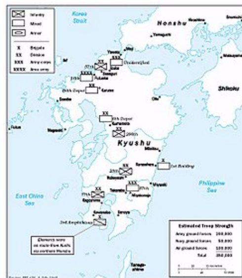
Americké odhady síly japonských jednotek na Kyūshū k 9. červenci 1945

Japonský plán na poražení invaze se jmenoval Operace Ketsugō (決号作戦, ketsugō sakusen ) („Operace Codename Rozhodující“). Japonci plánovali zavázat celou populaci Japonska k odporu proti invazi a od června 1945 byla zahájena propagandistická kampaň volající po „Skvělé smrti jednoho sta milionů“. [34] Hlavním poselstvím kampaně „Skvělá smrt jednoho sta milionů“ bylo, že bylo „slavné zemřít za svatého císaře Japonska a každý Japonec, žena a dítě by měli zemřít pro císaře, když spojenci dorazí“. [34] I když to nebylo realistické,