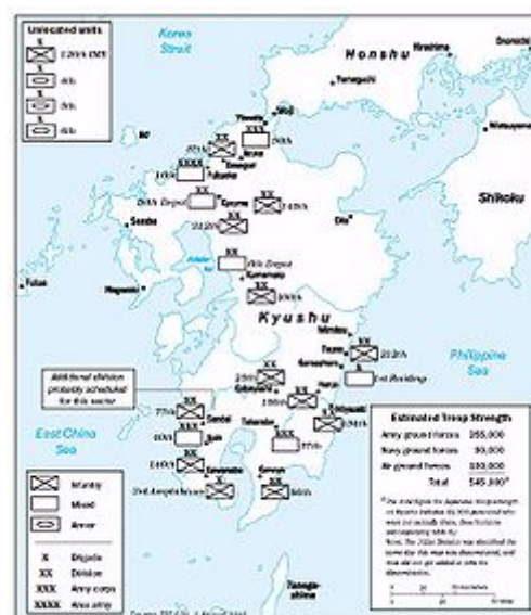
Americké odhady síly japonských jednotek na Kyūshū k 2. srpnu 1945