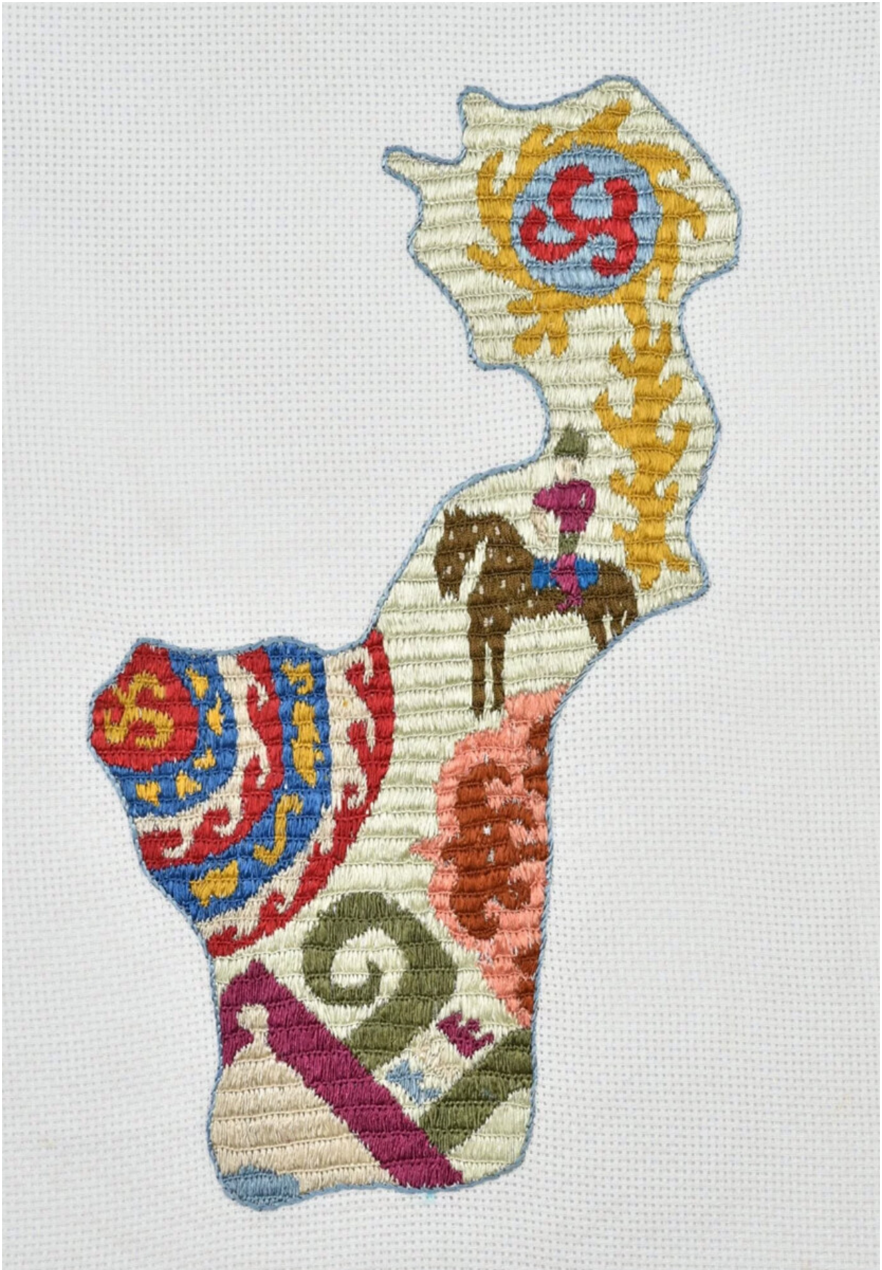
Dagestan on the map.

"Chuvash National Museum" / Ministry of Culture of Chuvashia