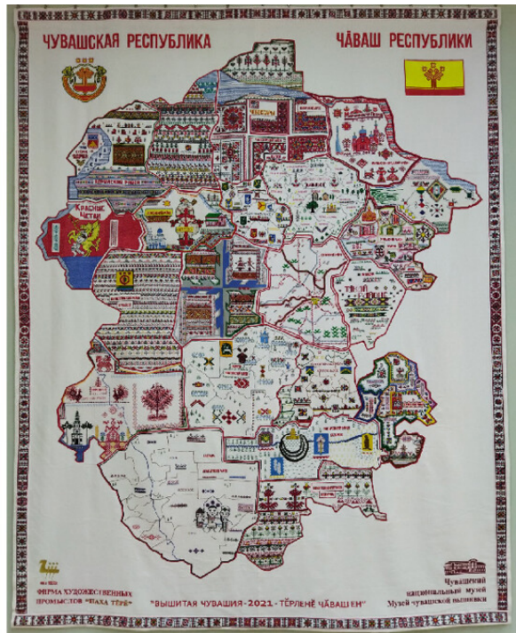
Maps made in 1937 and in 2021.

Chuvash National Museum / Ministry of Culture of Chuvashia