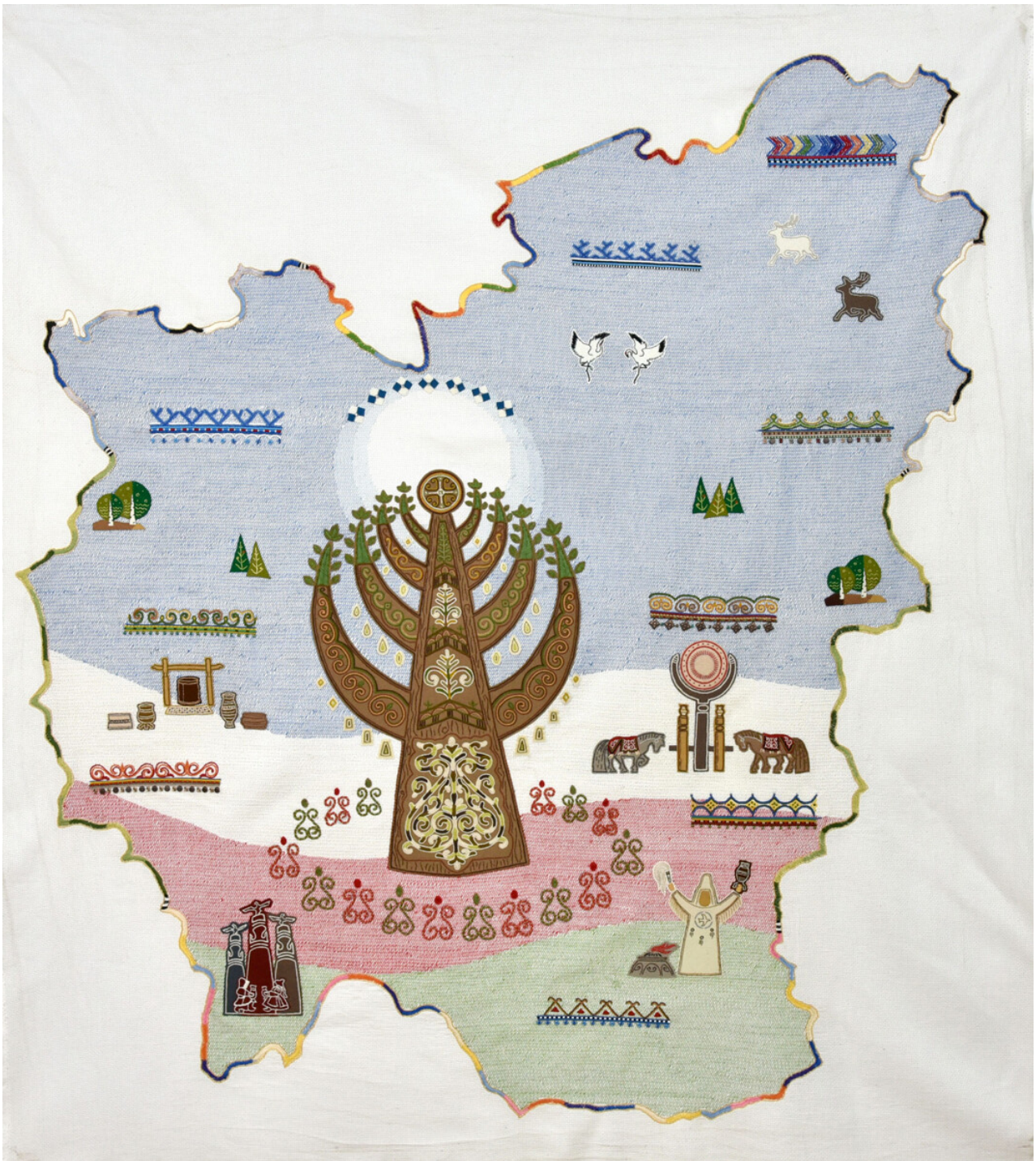
Yakutia on the map.

Another symbol common to many ethnic groups is the tree of life. The most noteworthy one is perhaps to be found on the embroidered map of Yakutia, which is adorned with symbolic “diamonds” (and not just diamonds) (you can read more here ). And, on their tree, the master embroiderers of Bashkortostan have represented the peoples living in various parts of the republic. In the east of Russia, in the