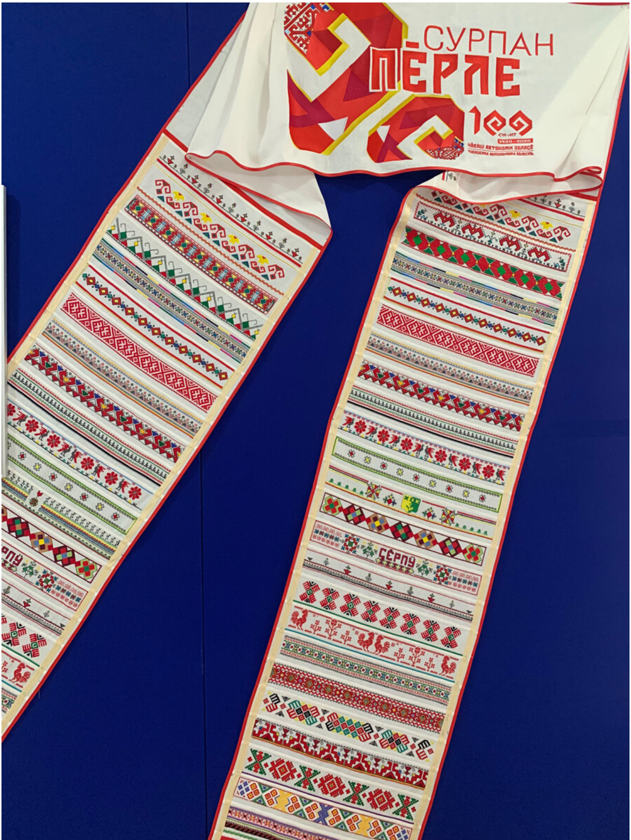
The embroidered surpan.

and then sewed it all together and presented it at the festival in 2020. There, people asked us: ‘And what are you going to do for next year?’ So we decided to embroider a map of Chuvashia.”