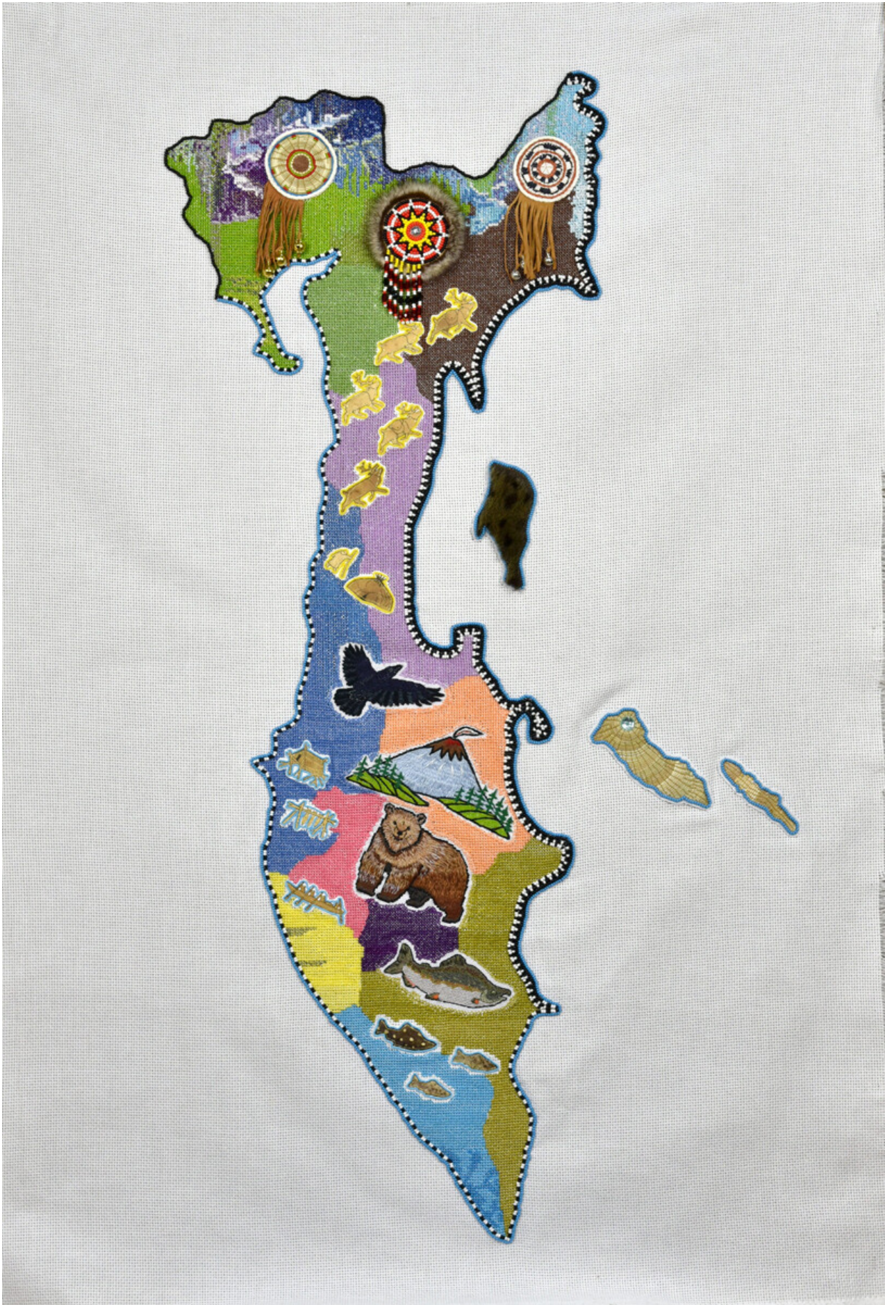
Kamchatka on the map.