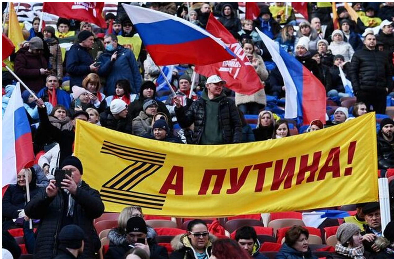
Diváci na stadionu při projevu Vladimira Putina

Problém je v tom, že těch nácků v převlečení za liberální demokraty je v Evropě a v USA tolik, že aby ty útoky proti Rusku přestaly, musel by Putin začít proces stalinizace procesů vojenského řízení a musel by obsadit celou Evropu a dokonale ji denacifikovat. Americký kongres jako hnízdo neonacistických procesů řízení to pouze potvrzuje.