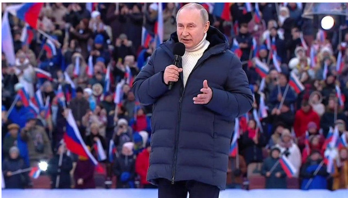
Vladimir Putin na stadionu Lužniky při projevu

Ruský prezident Vladimir Putin v pátek 18. března 2022 vystoupil v Moskvě na stadionu v Lužnikách s projevem k 8. výročí referenda o sjednocení Krymu s Ruskem. Na zaplněném stadionu si lidé vyslechli projev, který sice byl formální oslavou výročí připojení Krymu k Rusku, ale zazněly v něm věci s mohutným a poněkud hrozivým přesahem, až mi trochu zatrnulo. Vladimir Putin citoval z Písma svatého o obětování života za bližního svého jako nejvyšší formu lásky, přičemž toto vztáhl na probíhající boje na Ukrajině. Demonstrace jednoty lidu na stadionu byla impozantní, i když státní televize provedla obrovskou chybu a předčasně utnula Putinův projev a pustila vlasteneckou písničku Olega Gazmanova.