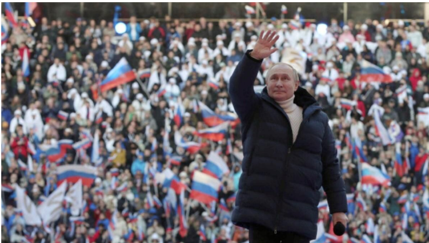
Vladimir Putin mává divákům na stadionu Lužniky

nacifikace. A po 8 letech na Ukrajině je situace taková, že tam už nebylo bezpečno ani pro ty etnické Rusy, kteří ani rusky nemluví, pouze mají etnický původ.