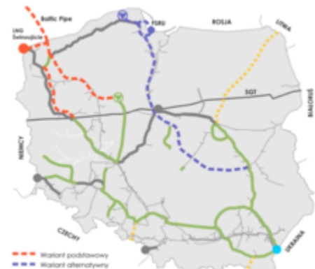
Cílová síť polských plynovodů

Projekt začal v roce 2001, kdy dánská ropná a plynárenská společnost DONG a polská ropná a plynárenská společnost PGNiG podepsaly smlouvu o výstavbě plynovodu a dánských dodávkách plynu do Polska. [8] Bylo dohodnuto zřízení konsorcia pro plynovody