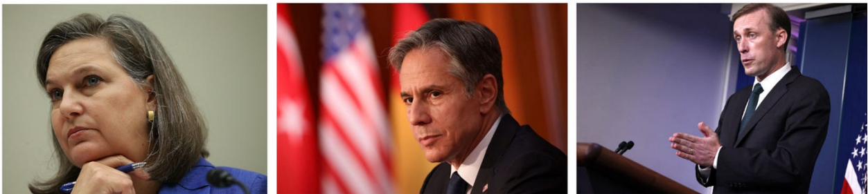
HRÁČI Zleva doprava: Victoria Nulandová, Anthony Blinken a Jake Sullivan.

Podle zdroje přímo obeznámeného s procesem bylo účastníkům jasné, že Sullivan měl v úmyslu, aby skupina přišla s plánem na zničení obou plynovodů Nord Stream – a že plní přání prezidenta.