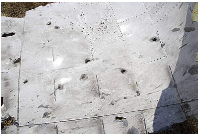
Díry po kulkách na vnějším plášti

Co se tedy mohlo stát? Rusko zveřejnilo radarové záznamy ukazující nejméně jeden ukrajinský SU 25 v těsné blízkosti MH 017. Tomu odpovídá i výpověď pohřešovaného španělského dispečera, který v bezprostřední blízkosti MH 017 viděl dvě ukrajinské stíhačky. Podívejme se na výzbroj SU 25: Je vybaven dvouhlavňovým 30mm kanónem, typ GSch-302/AO-17A, bojový náboj: 250 nábojů protitankových zápalných nebo tříštivo-výbušných střel, které jsou odpalovány v definovaném pořadí a jsou připevněny k pásu na dezintegraci končetin. Do kokpitu MH 017 se střílelo ze dvou stran: vstupní a výstupní otvory na stejné straně.