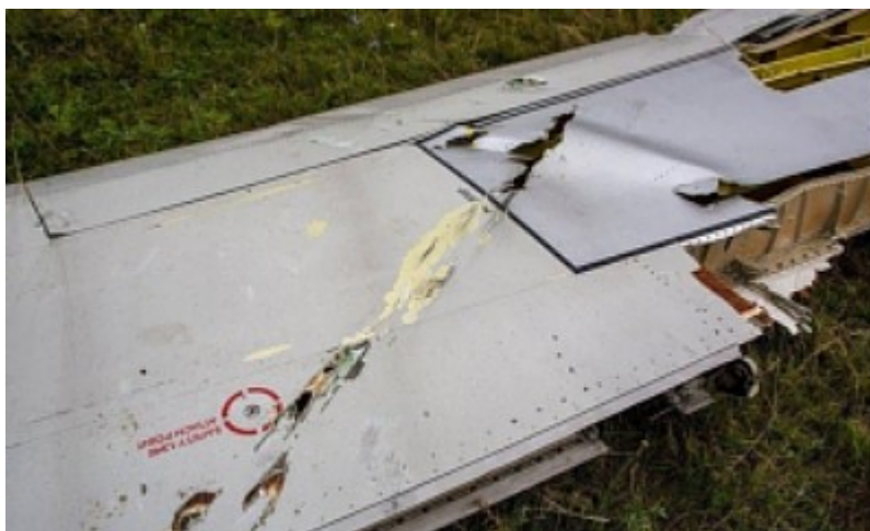
pasoucí se střela na křídle

Protože vnitřek komerčního letadla je hermeticky uzavřený prostor, tyto exploze způsobí, že tlak uvnitř letadla dramaticky vzroste během zlomků sekundy. Letadlo na to není vybaveno. Praskne jako balón. S tímto vysvětlením vzniká ucelený obraz. Z velké části neporušené úlomky zadních sekcí se roztrhly v bodech, u nichž je pravděpodobné, že se kvůli konstrukci roztrhnou při extrémním přetlaku. Obraz široce rozptýleného pole trosek a brutálně poškozeného segmentu kokpitu tomu zapadá. Kromě toho segment křídla vykazuje stopy po pastevním výstřelu, který v prodloužení vede přímo do kokpitu. Zajímavé je, že jsem našel že jak fotografie segmentu kokpitu ve vysokém rozlišení, tak fotografie oděru na křídle byly mezitím odstraněny z obrázků Google. Snímky trosek už prakticky neexistují, kromě kouřící trosky.