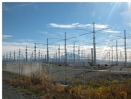
HAARP na Aljašce

Souřadnice: 62°23'30" s. š. , 145°9'0" z. d. ( mapa ) (přesměrováno z Haarp )