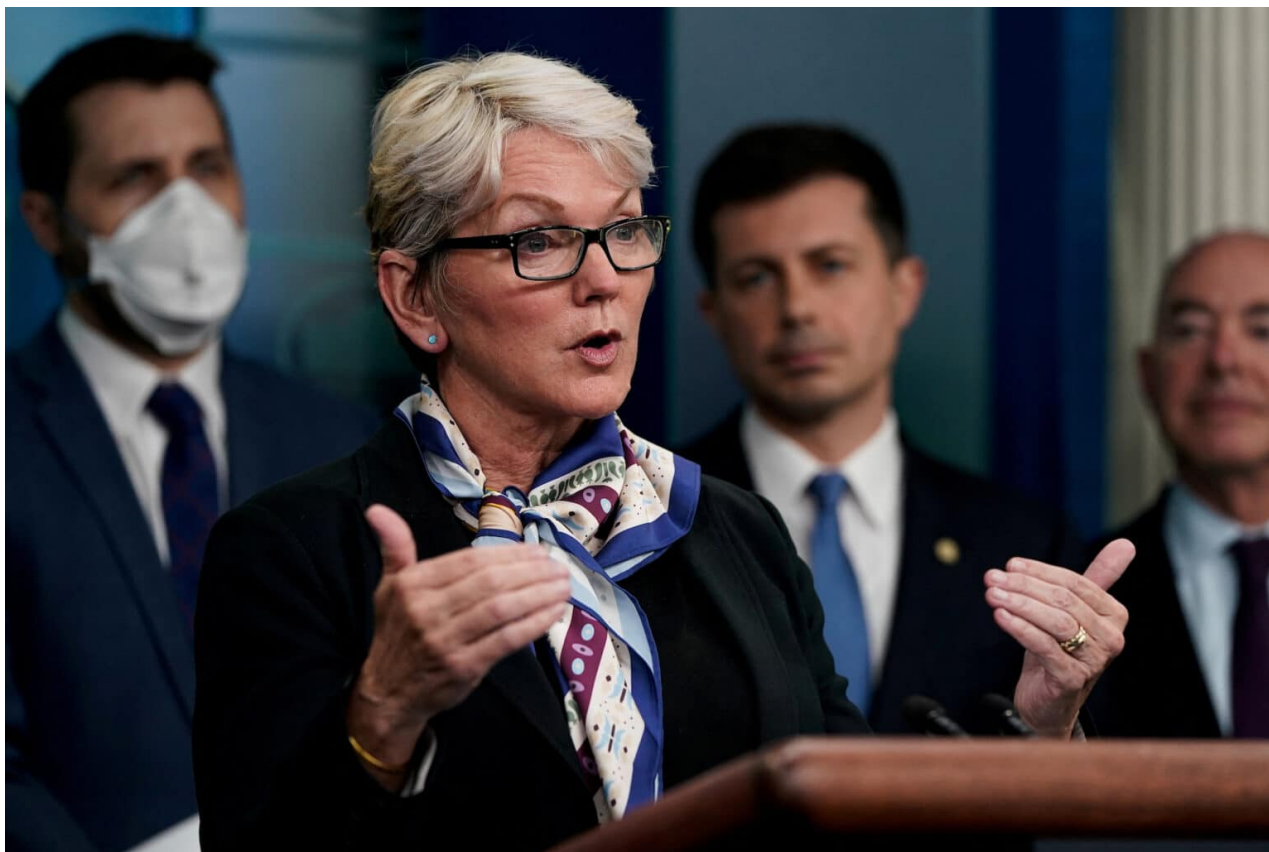
Ministryně energetiky Jennifer Granholmová, Foto: Reuters

miliardy amerických dolarů. Takříkajíc je to však jen startovné. „Požadavek je součástí širšího plánu vynaložit miliardy na vytvoření průmyslu se sídlem v USA na obohacování uranu a další služby potřebné k výrobě paliva pro reaktory prostřednictvím nákupu suroviny od domácích výrobců,“ objasnil Bloomberg.