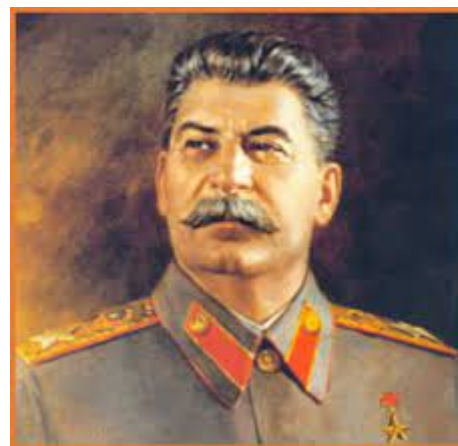
Josif Džugašvili Stalin

Pařížská pobočka Rothschildovy banky zafinancovala celý vzestup NSDAP k moci s jediným cílem, aby Adolf Hitler, ve skutečnosti vnuk Solomona Rothschilda z Vídně, dokončil v Rusku s německou armádou to, co nedokázal dokončit ani Napoleon, ani Lenin. A jak víme, nepodařilo se to ani Hitlerovi. Pokaždé, když se globalisté pokusí dobýt Rusko silou a vojensky, tak to selže. Jenže ve skutečnosti se po II. sv. válce stalo něco daleko horšího pro Dům Sion. Globalizaci lze budovat jen tehdy, budou-li Západ a Východ spolupracovat. V opačném případě je světová vláda zcela vyloučena.