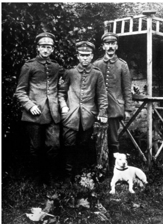
Německý voják první světové války Adolf Hitler (zcela vpravo)