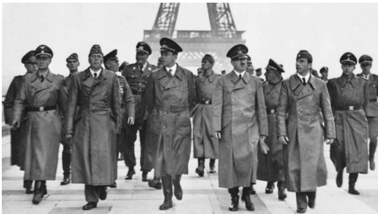
Adolf Hitler vedl své generály přes most v Paříži poté, co obsadil město