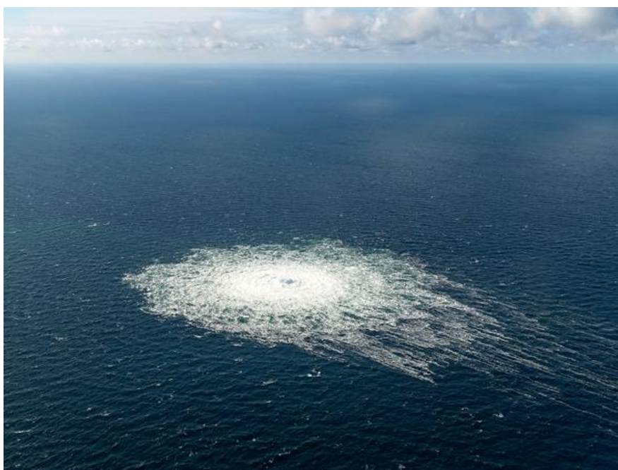
Pěna indikuje netěsnost.

Jako první krok se zintenzivňuje kontrola německých suverénních vod federální policií, jejíž lodě blíže sledují příslušné trasy kritické infrastruktury. Kromě toho by spolkové země měly posílit ochranu pobřežních oblastí Severního a Baltského moře. Důvodem k obavám je také ochrana v současnosti budovaných terminálů na zkapalněný plyn a podmořských a telekomunikačních kabelů.