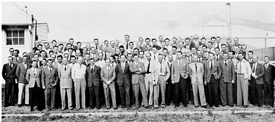
Tým Paperclip v Fort Bliss, Texas

Skočit na navigaci Skočit na vyhledávání