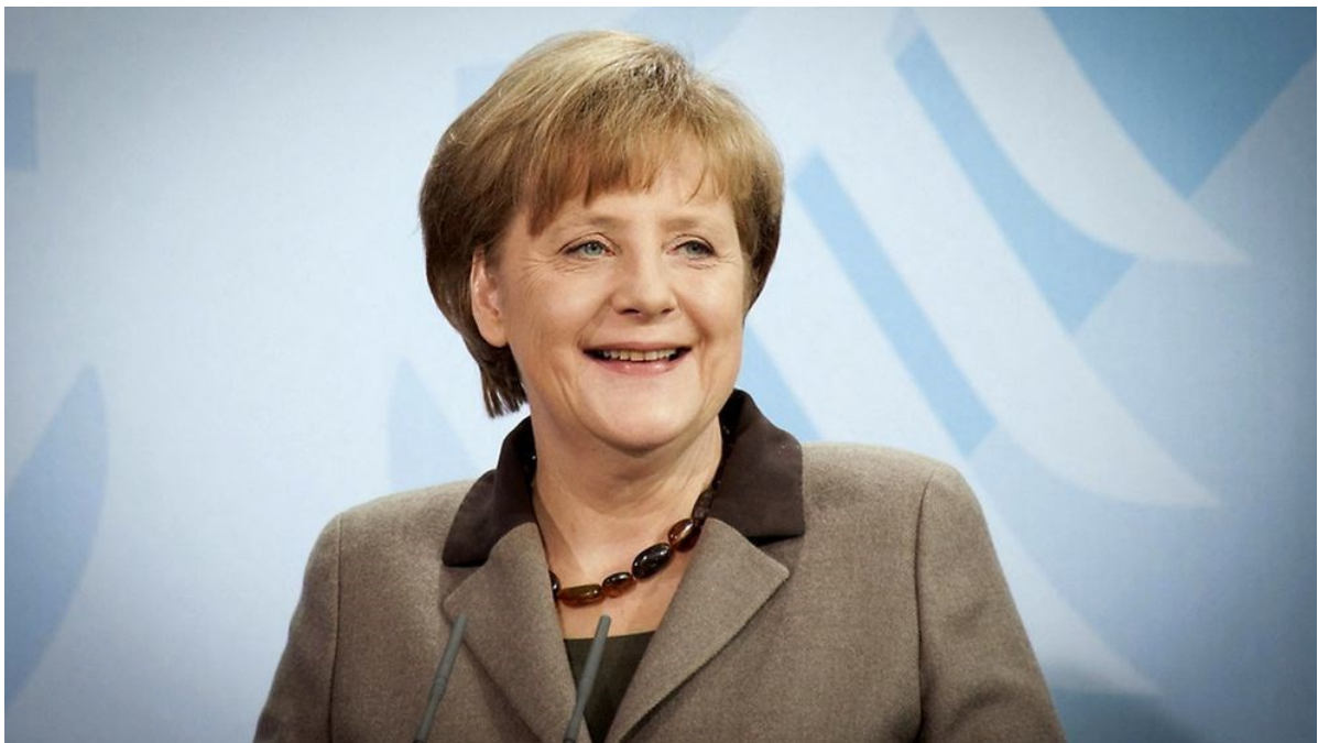
Německá bývalá kancléřka Angela Merkelová

Německá bývalá kancléřka Angela Merkelová prozradila, že v roce 2014 měly Minské dohody za cíl poskytnout Ukrajině čas na posílení a NATO zvýšit svou podporu zemi tváří v tvář Rusku.