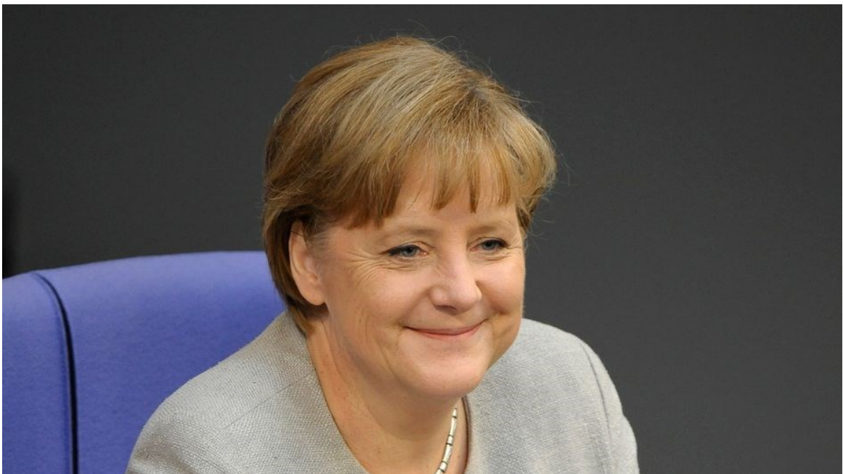
Angela Merkelová, bývalá kancléřka Německa.

Bývalá německá kancléřka nelituje dohod o zemním plynu, které uzavřela mezi Berlínem a Moskvou.