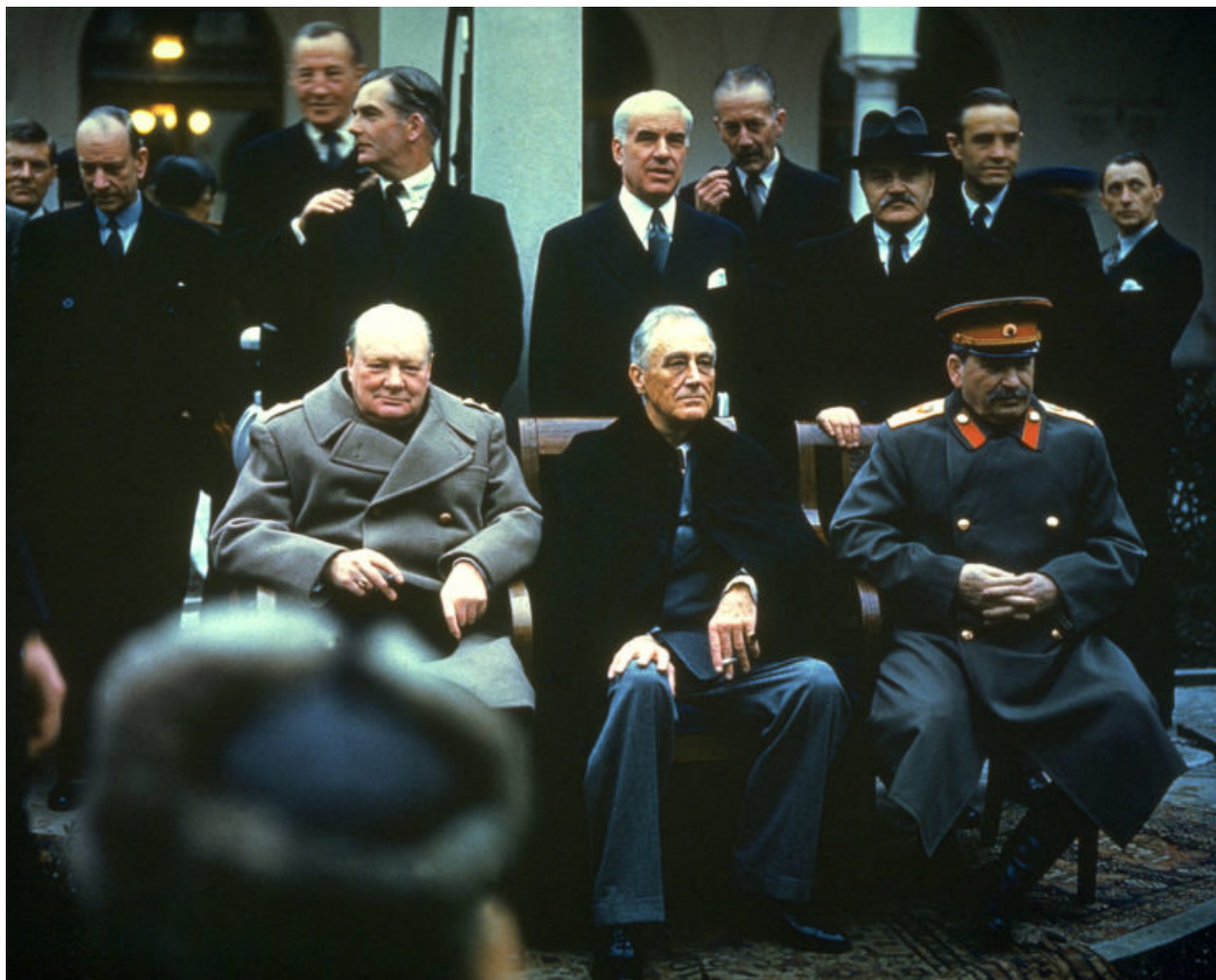
Britský premiér Winston Churchill, americký prezident Franklin D. Roosevelt a sovětský vůdce Joseph Stalin na konferenci v Jaltě, únor 1945.

V květnu 1945 Churchill nařídil vypracování série plánů s kódovým označením „Operace Unthinkable“, která stanovila možnost války proti Rusku, aby se zmocnila kontroly nad takovými zeměmi okupovanými Sověty, jako je Polsko. Tyto plány, vymyšlené Společným plánovacím štábem, nebyly nikdy schváleny, ale pokud by pokračovaly, 1. července 1945 by nastal násilný konflikt.