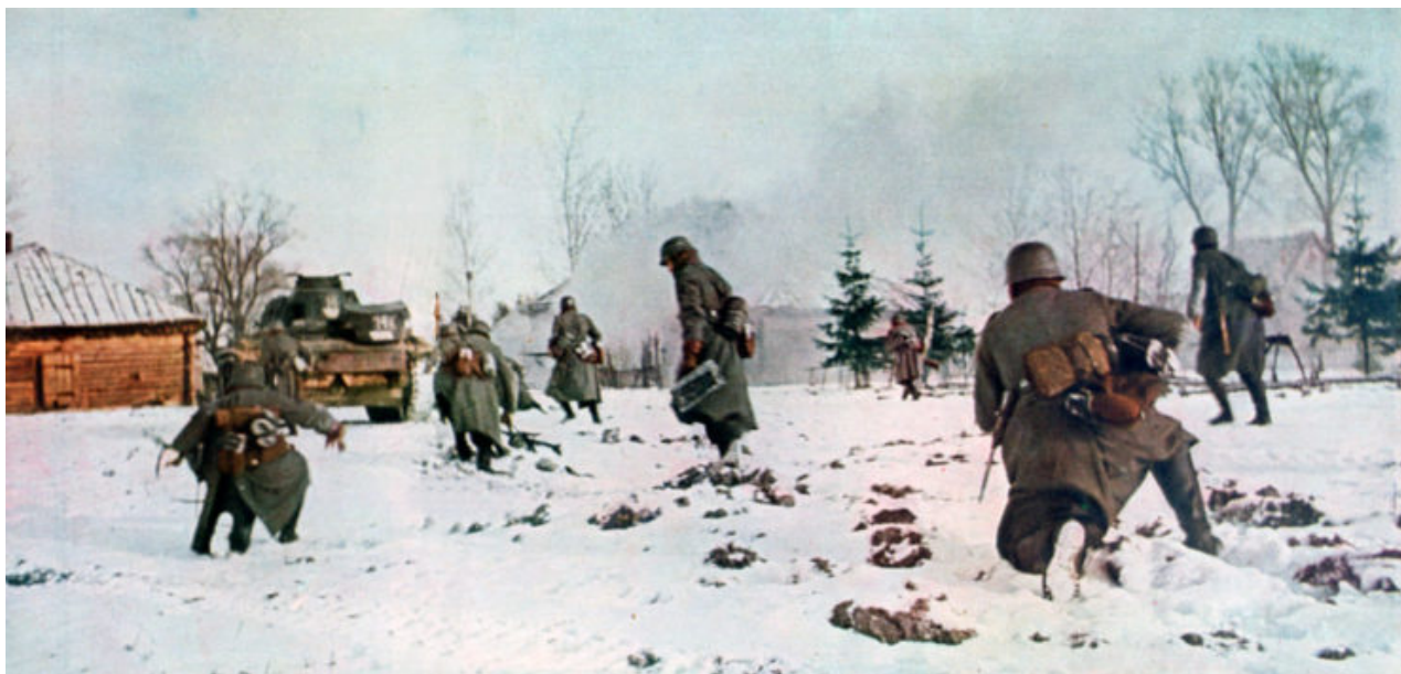
Němečtí pěšáci následují tank směrem k Moskvě, 1941.

Původní plán byl sešrotován a na jeho místě vznikl druhý. To představovalo scénář, v němž by se Britové museli bránit proti Sovětům, když se pohybovali směrem k Severnímu moři a Atlantskému oceánu poté, co se USA vrátily domů. Churchill se zvláště obával, že Polsko bude i nadále hlavním cílem sovětské agrese během této doby.