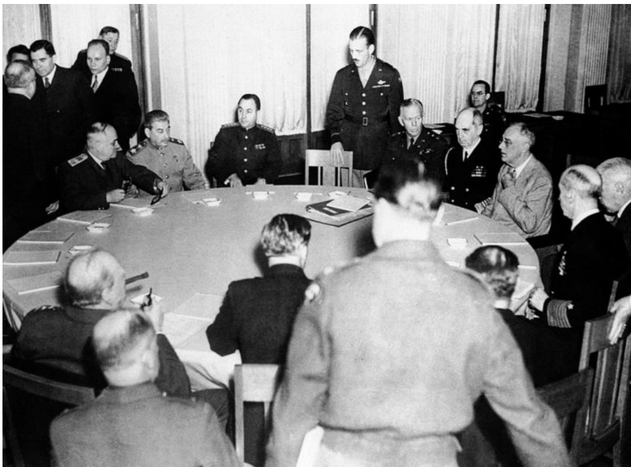
Sovětský vůdce Joseph Stalin, britský premiér Winston Churchill a americký prezident Franklin D. Roosevelt během setkání v paláci Livadia během konference v Jaltě v únoru 1945.

Potenciální operace také zahrnovala plán pro britské, americké, polské a dokonce i německé síly pokusit se osvobodit Polsko a východní Německo od Stalinovy vlády. Pokud by v tomto úsilí neuspěli, riskovali spojenci vstup do třetí světové války.