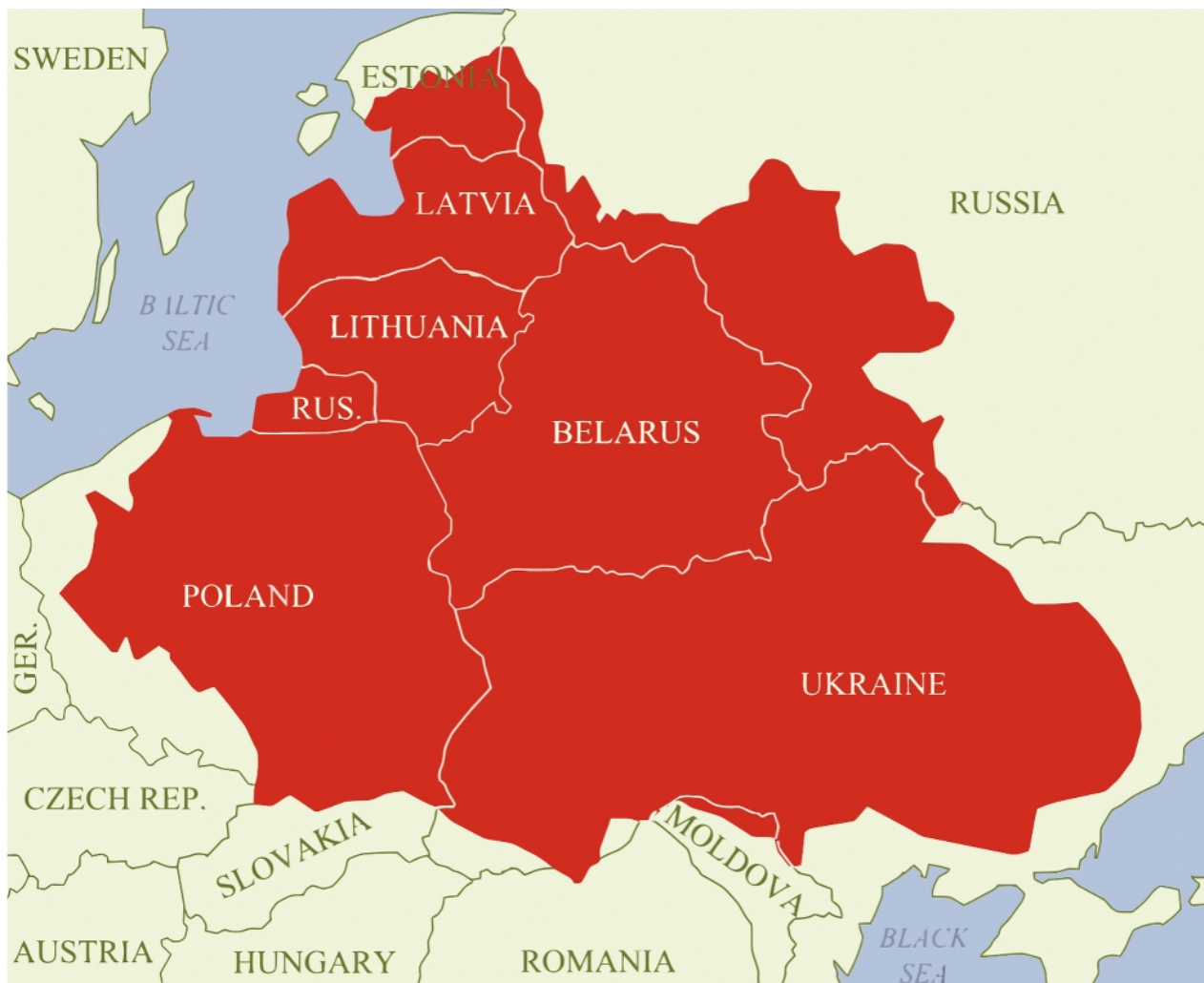
Území polsko-litevského společenství v maximálním rozsahu v 17. století.

Papers. Po konci dynastie Jagellonců se proměnila ve volební monarchii, podobnou městským státům v Itálii, ale fungující v mnohem větším měřítku,“ poznamenává americký časopis.