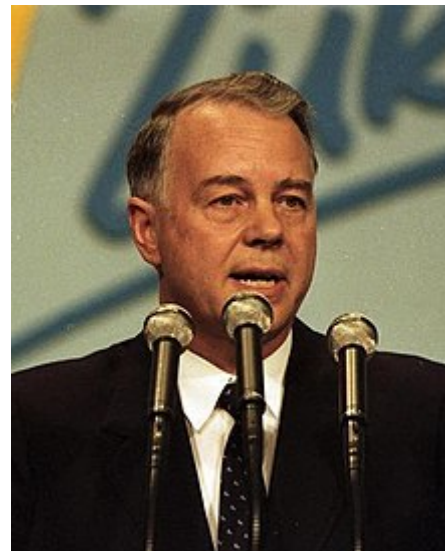
Ernest Albrecht, 1988

V roce 1954 se stal atašé Rady ministrů Montanunionu , v roce 1958 byl šéfem kabinetu člena Komise EHS Hanse von der Groebena a v roce 1969 byl generálním ředitelem pro hospodářskou soutěž EG . [ 1 ] V letech 1971 až 1976 byl