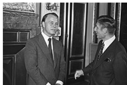
Albrecht s nizozemským premiérem Driesem van Agtem (1978)

V roce 1978 byla Albrechtova vláda zodpovědná za falešný bombový útok na přísně střeženou věznici v Celle , známou jako Celler Loch , s cílem infiltrovat informátory na levicovou teroristickou scénu kolem Frakce Rudé armády . Během svého funkčního období vedl kampaň za to, aby se Dolní Sasko v roce 1979 stalo první spolkovou zemí, která přijme 1 000 vietnamských uprchlíků ( lodí na lodích ). [22]