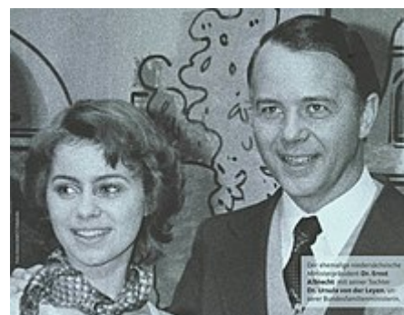
Albrecht se svou dcerou Ursulou von der Leyen (plakát CDU, 2007)