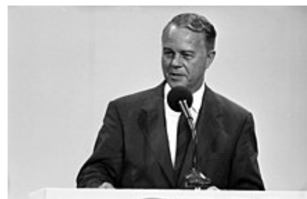
Albrecht na konferenci federální strany CDU v roce 1989

V období před federálními volbami v roce 1980 byl Albrecht vyměněn za možného kandidáta na kancléře CDU/CSU. Po týdnech veřejné debaty zvolila poslanecký klub CDU/CSU v Bundestagu jako společného kandidáta na kancléře Franze Josefa Strausse z CSU s 57 % hlasů . Strauß následně prohrál volby s Helmutem Schmidtem .