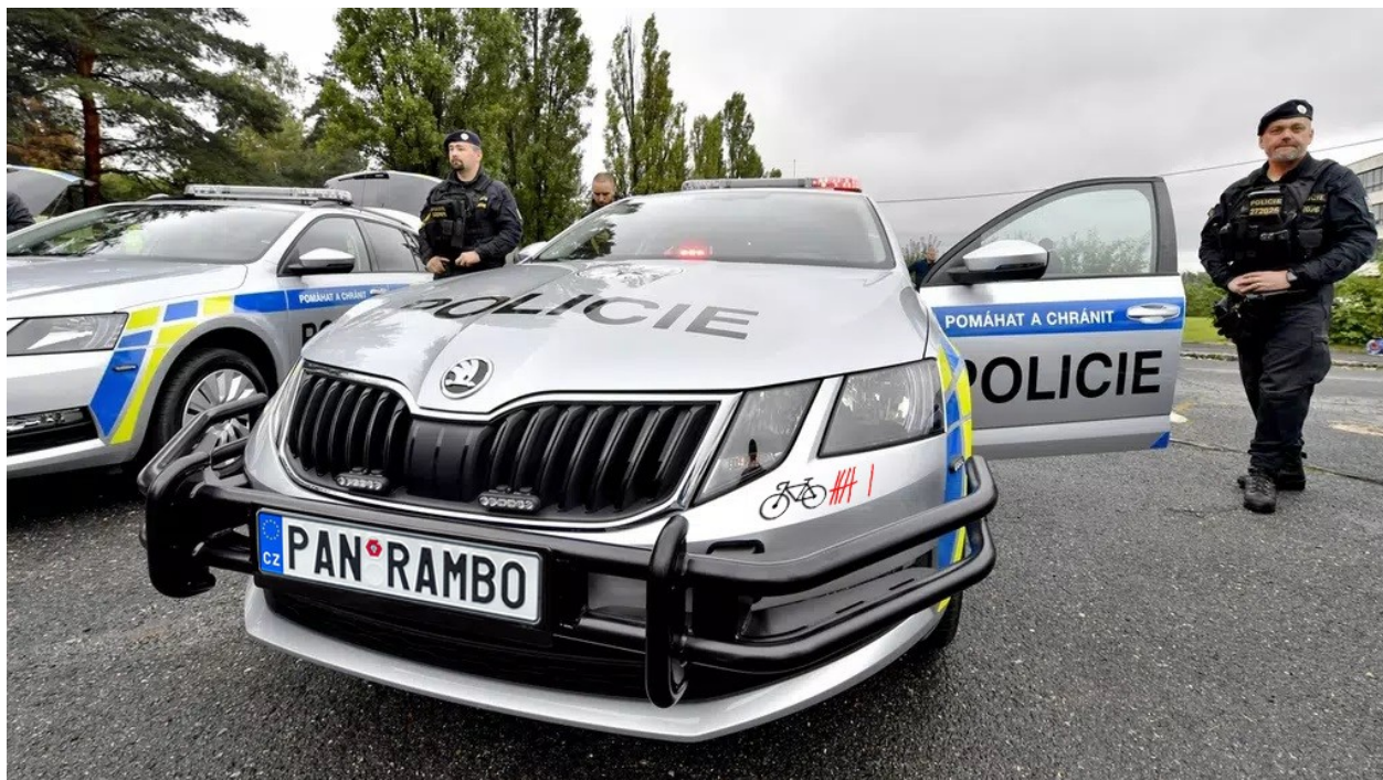
Fotokoláž Kverulant | Zdrojové foto: Policejní Octavie s rámem

Trubkové rámy a PIT manévry jsou podle Kverulanta idiotským anachronismem, který ukazuje, jak „progresivně“ o nás „civilích“ přemýšlejí policejní generálové ve Strojnické ulici. Kromě toho, že rámy zcela otevřeně kašlou na ochranu nejslabších typu cyklista/chodec, nezohledňují ani další trendy v evropské mobilitě. Jde například o chytré a rychlé elektronické systémy stabilizace. Převažujícími vozy na silnicích jsou dávno auta s vyšším těžištěm, typu SUV, pro které jsou PIT manévry ještě nebezpečnější než pro auta nižší. A co elektromobilita – budou policisté tupě bourat i do aut s akumulátory, aby riskovali následky neuhasitelného masivního požáru při poškození baterek?