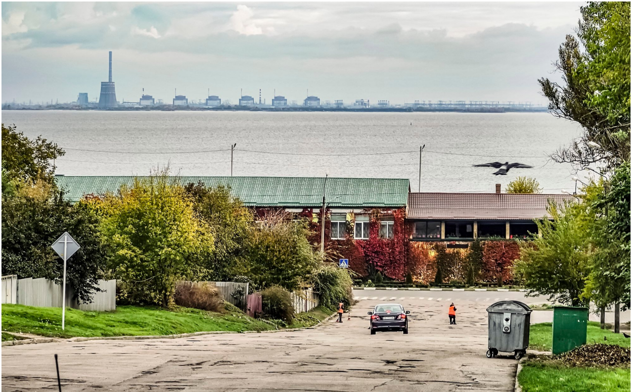
The Zaporizhzhia nuclear power plant is seen from Nikopol, Ukraine in October 2022.

Earlier on Saturday, the International Atomic Energy Agency (IAEA) said external power had been restored to the Russian-occupied Zaporizhzhia nuclear power plant in southern Ukraine