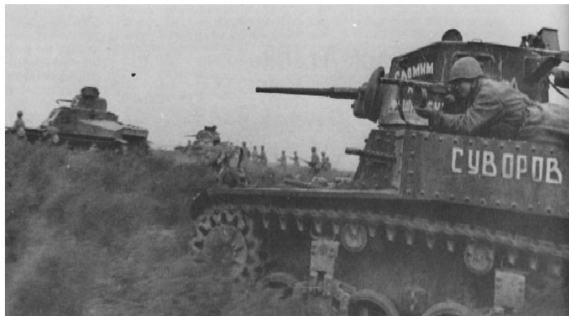
Foto: Lehký tank M3A1 Stuart pojmenovaný "Suvorov" veze samopalníky k bitvě o Stalingrad

Kritici „americké pomoci“ často poukazují na nerovnoměrnost dodávek automobilů i na to, že více jak polovina vozidla byla dodána v posledních dvou letech války. To ovšem nebylo způsobeno dřívější „neochotou“ Američanů poskytnout Sovětskému svazu vozidla, ale čistě tím, že Sovětský svaz prostě požadoval jiné komodity. Obrovské ztráty obrněné i letecké techniky v roce 1941 prostě bylo potřeba co nejdříve nahradit a automobily by tomu moc nepomohly, potřeba byly hlavně tanky a letadla. V září 1941 Stalin poslal dopis přímo Winstonu Churchillovi s prosbou a požadavkem o dodávky 30 000 tun hliníku a opakovanou pomoc v minimálním měřítku 400 letadel a 500 lehkých a středních tanků měsíčně. Ve zlomovém roce 1943, kdy se produkce sovětské obrněné techniky a letadel dostala na předválečnou úroveň a brzy i mnohem vyšší, již letadla a tanky nebyly tak zapotřebí, jelikož si Sovětský svaz už dokázal vyrobit odpovídající počty sám. Výrazně však narostla nutnost vojáky co nejrychleji přepravovat. V souladu s novým sovětským požadavkem tak ustoupily dodávky obrněné techniky ve prospěch dodávek automobilů a náhradních dílů k nim, benzínu a pneumatik.