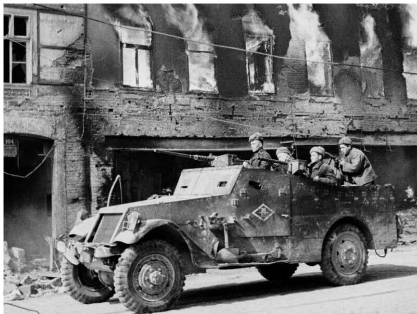
Foto: Průzkumníci 1. gardového mechanizovaného sboru projíždí v obrněném voze M3 ulicí ve Vídni. 1945.

Statistiky letadel jsou ještě působivější: každý pátý stíhač nebo bombardér, který během války Rudá armáda obdržela, byl britské či americké výroby. Zároveň každé čtvrté protiletadlové dělo bylo buď americké, nebo britské.