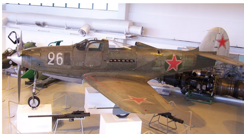
Foto: Bell P-39 Aircobra "Bílá 26" ve finském muzeu v Tikkakoski. Aircobra byla pro sovětské nebe jako stvořená, na Východní frontě se bojovalo především v nízkých výškách, kde Aircobra dominovala.

S tvrzením o nízké kvalitě dodávaného materiálu se můžeme pravidelně setkat i dnes, což jen ukazuje, jak tento mýtus mezi lidmi úspěšně zakořenil.