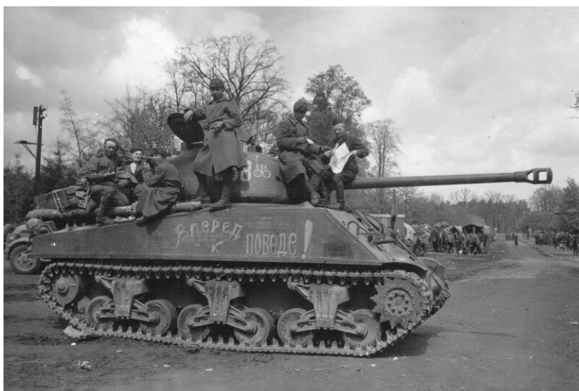
Foto: Symbolem Lend-Lease je bezpochyby tank Sherman. Zde ve verzi M4A2 (76), tedy nejpočetnější verzi. Na fotografii Sherman z výzbroje 64. gardového tankového pluku, 8. gardového mechanizovaného sboru. Město Grabow, 3. května 1945

Významnou část dodávek také tvořily obráběcí a výrobní stroje a nářadí, bez nich by se sovětský válečný průmysl nepostavil na nohy tak rychle a produkce válečného materiálu by nebyla tak objemná.