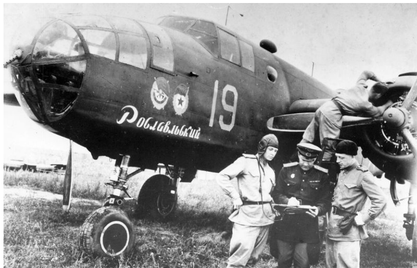
Foto: Sovětská posádka bombardéru B-25 Mitchell. Američané jich dodali dost k vyzbrojení téměř 9 leteckých divizí.

výkonech (Stuart byl rychlejší a jízda v něm mnohem pohodlnější) a řadě dalších významných ukazatelů, jako například průbojnost hlavního děla. 45mm kanón tanku T-70 byl schopný na 500 metrů prorazit 59mm tlustý pancíř, zatímco 37mm kanón tanku Stuart byl schopný na 500 metrů prostřelit pancíř tlustý 65mm.