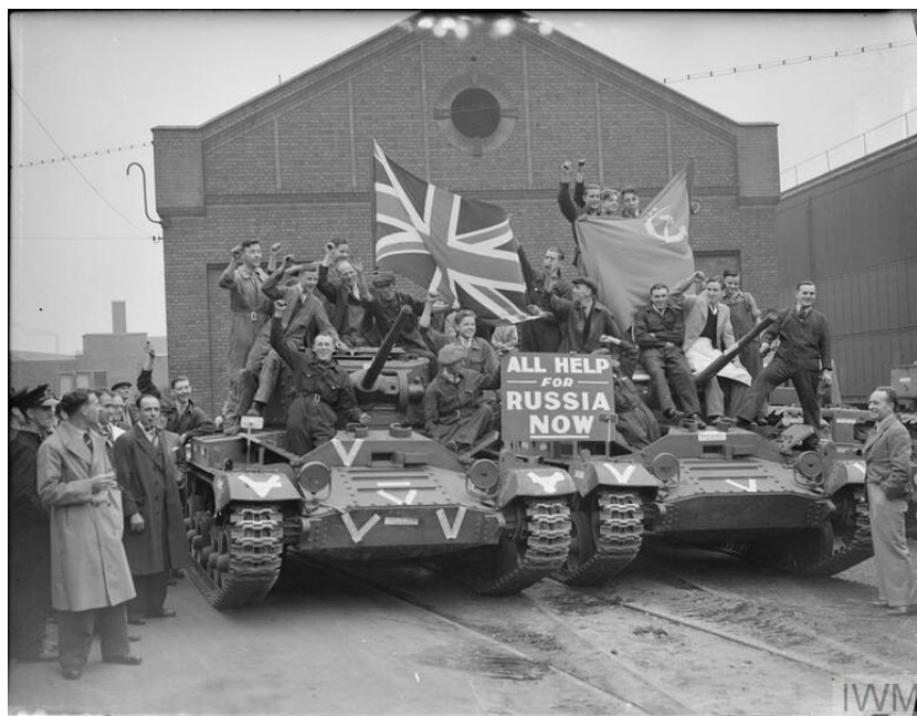
Foto: Dělníci s transparenty na nově vyrobeném tanku Valentine pro Sovětský svaz. Září 1941

Jsme schopni porovnat údaje o dodávkách jen v porovnání se sovětskou produkcí, a to však pouze u některých komodit. U některých komodit hraje velkou důležitost kvalita produktu, například oktanové číslo automobilového benzínu vyrobeného na Západě bylo vyšší než sovětského paliva, nákladní automobily dodané Spojenými státy byly také podstatně kvalitnější vyrobené než sovětská nákladní auta. Ony pověstná 4 % tak s největší pravděpodobností byla jen výmyslem poplatným době.