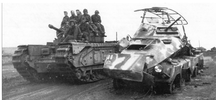
Foto: Těžký tank Churchill III míjí vyřazené německé obrněné vozidlo Sd.Kfz. 232. Čtvrtvá bitva o Charkov, červenec 1943 | Wikimedia Commons / Public domain

Totéž lze říci i o letadlech. Stíhače P-39 Airacobra byly po válce často vytýkány vysoké nároky letounu na techniku pilotáže, už se ovšem nemluví o sovětských letounech Polikarpov I-16 či Lavočkin LaGG-3, které pilotům odpouštěly ještě méně chyb. Bylo by však nespravedlivé nepovšimnout si i výhod, jako byla například velice silná a efektivní výzbroj. Vždyť americká Airacobra vychovala spoustu skvělých sovětských leteckých es, jako byl například Nikolaj Gulajev, který se s 57 sestřely stal třetím nejúspěšnějším sovětským stíhacím esem. Alexandr Pokryškin byl zas druhým nejúspěšnější spojeneckým leteckým esem s celkem 59 sestřely, nebo Grigorij Rečkalov, který se stal se svými 56 sestřely čtvrtým nejúspěšnějším spojeneckým stíhačem.