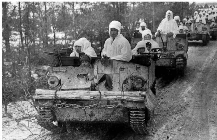
Foto: Kolona transportérů Universal Carrier se sovětskou pěchotou. Zima 1942 | Wikimedia Commons / Public domain

Američtí lidé posílali vše, co se dalo a převážně tanky Sherman ze Spojených států byly vždy plné dalších „dárečků“ od amerického obyvatelstva. Shermany tak byly vždy plné bot, zimního oblečení, svetrů, jídla, ale také povzbudivých dopisů či sladkostí, prostě vším, co si Američané mysleli, že by se mohlo Sovětským vojákům v boji hodit. Jednalo se o věci od zaměstnanců továren a jejich rodin, ale i od obyčejného civilního obyvatelstva, které chtělo Rudým vojákům boj v tuhé zimě co nejvíce zpříjemnit. Taková nezištná pomoc samozřejmě nepodléhá žádným statistikám, a není tedy možné spočítat, kolik a čeho Američané takto poslali navíc, jistě to však budou desítky tun různého zboží.