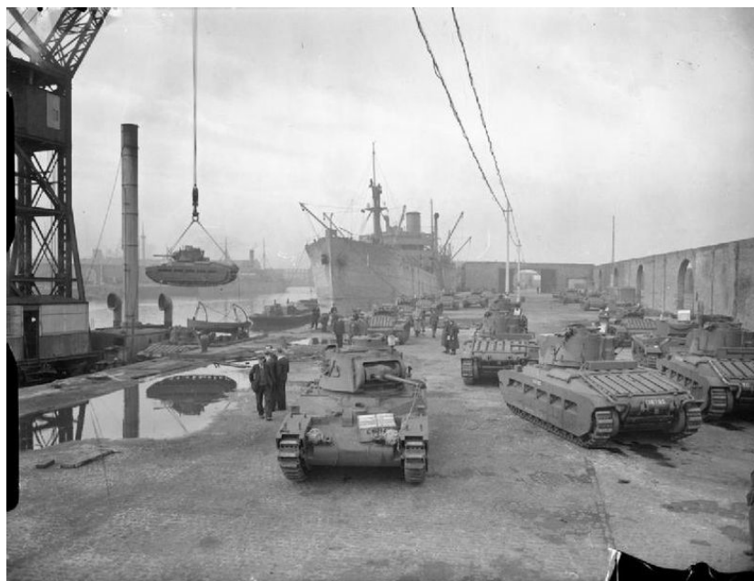
Tanky Matilda II čekají v Liverpoolu na naložení a cestu do Sovětského svazu. 17. října 1941

Potvrzují to i slova Georgije Konstantinoviče Žukova, který v jednom z rozhovorů vypověděl: „Bez amerických Studebakerů bychom neměli na čem vést naše dělostřelectvo. Ano, z velké části zajišťovaly americké nákladáky obecně naši frontovou dopravu.“