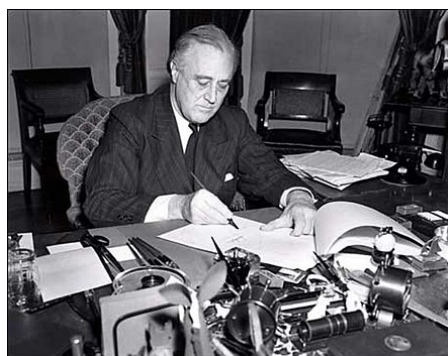
Prezident Franklin Delano Roosevelt podepisuje Zákon o půjčce a pronájmu.