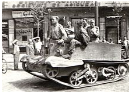
Vstup sovětské armády do Bukurešti v srpnu 1944. Na fotografii je britský Universal carrier , pronajatý v rámci smlouvy „Lend-Lease“.