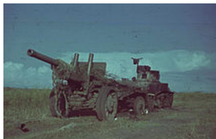
Americký lehký tank M3 Stuart , ukořistěný Němci na východní frontě (květen 1942).

Podpora bojujícího Sovětského svazu měla nejen formu vojenských dodávek, ale i strategických civilních dodávek. SSSR byl zemí, jejíž průmyslová a potravinářská základna byla válkou těžce poškozena a to již v prvních měsících bojů. Řada továren byla sice evakuována a mnoho dalších nově postaveno, ale všechny se soustřeďovaly primárně na výrobu zbraní a munice, proto byly civilní dodávky pro