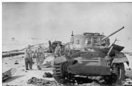
Zničený britský Mk III Valentine , používaný Rudoarmějci – východní fronta, leden 1944.