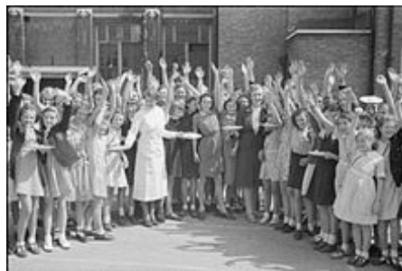
Britské šolačky děkují za potravinovou pomoc dodanou z USA (přelom srpna a září 1941).

Dodávky trvaly od března 1941 do 20. září 1945. Celkový objem dodávek představoval částku 50,1 miliardy dolarů, z této částky dostala Velká Británie 31,4 miliardy, SSSR 11,3 miliardy, Francie 3,2 miliardy, Čankajškova Čína 1,6 miliardy a ostatní spojenci (Brazílie, Norsko, Nizozemsko...) dostali celkem 2,6 miliardy dolarů (ČSR 0,6 miliardy).