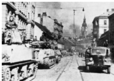
Tanky Sherman ve výzbroji Rudé armády na Křenové ulici v Brně v dubnu 1945

SSSR životně důležité. Ačkoli většina tankových jednotek Rudé armády byla vybavena tanky sovětské výroby, jejich logistická podpora byla poskytována stovkami tisíc amerických kamionů. V roce 1945 pocházela třetina logistického vozového parku Rudé armády z USA.