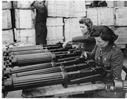
Britská kontrola kvality kulometů Vickers, 1941.

Část dluhu Velké Británie byla splacena již během války, a to v podobě poskytnutých cenných technologií, důležitých pro vývoj a konstrukci – radaru, sonaru, proudových motorů, bazook, raket, gyroskopu, samotěsnících palivových nádrží, plastických výbušnin, jaderné energie, magnetronu. A dále v podobě námořních a leteckých základen rozsetých po britských koloniích, a také dodávkami surovin z britských kolonií a dominií a taktéž poskytnutím vojenské techniky (například USAAF byly poskytnuty stovky letadel Spitfire Mk V a Mk VIII). Zbytek dluhu pak byl propojen s novými úvěry z Marshallova plánu, kdy 90 % dluhu bylo odpuštěno (zbraně byly zcela odepsány a civilní zařízení prodáno Velké Británii za 10 % ceny).