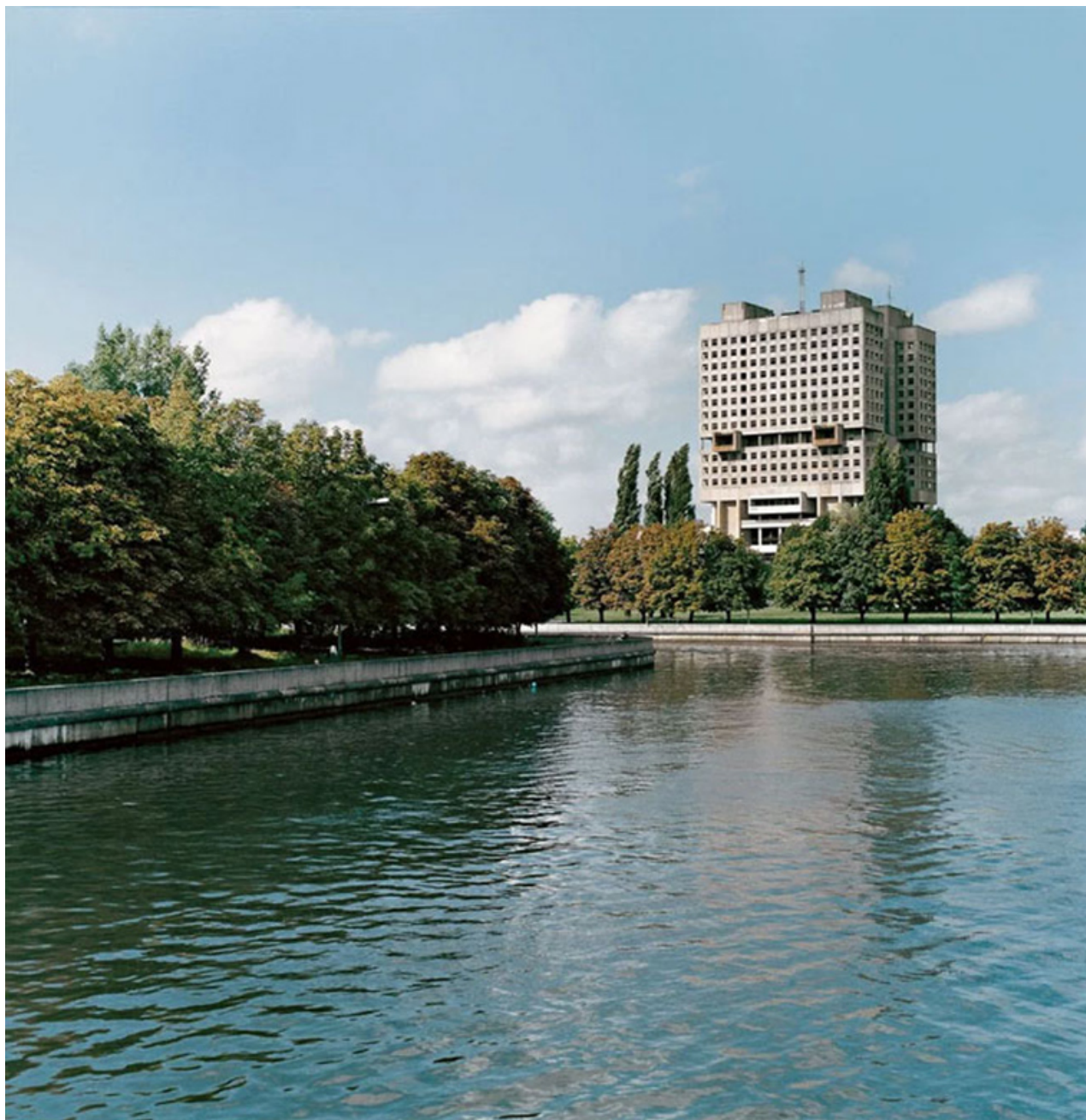
Polytechnický institut v Minsku