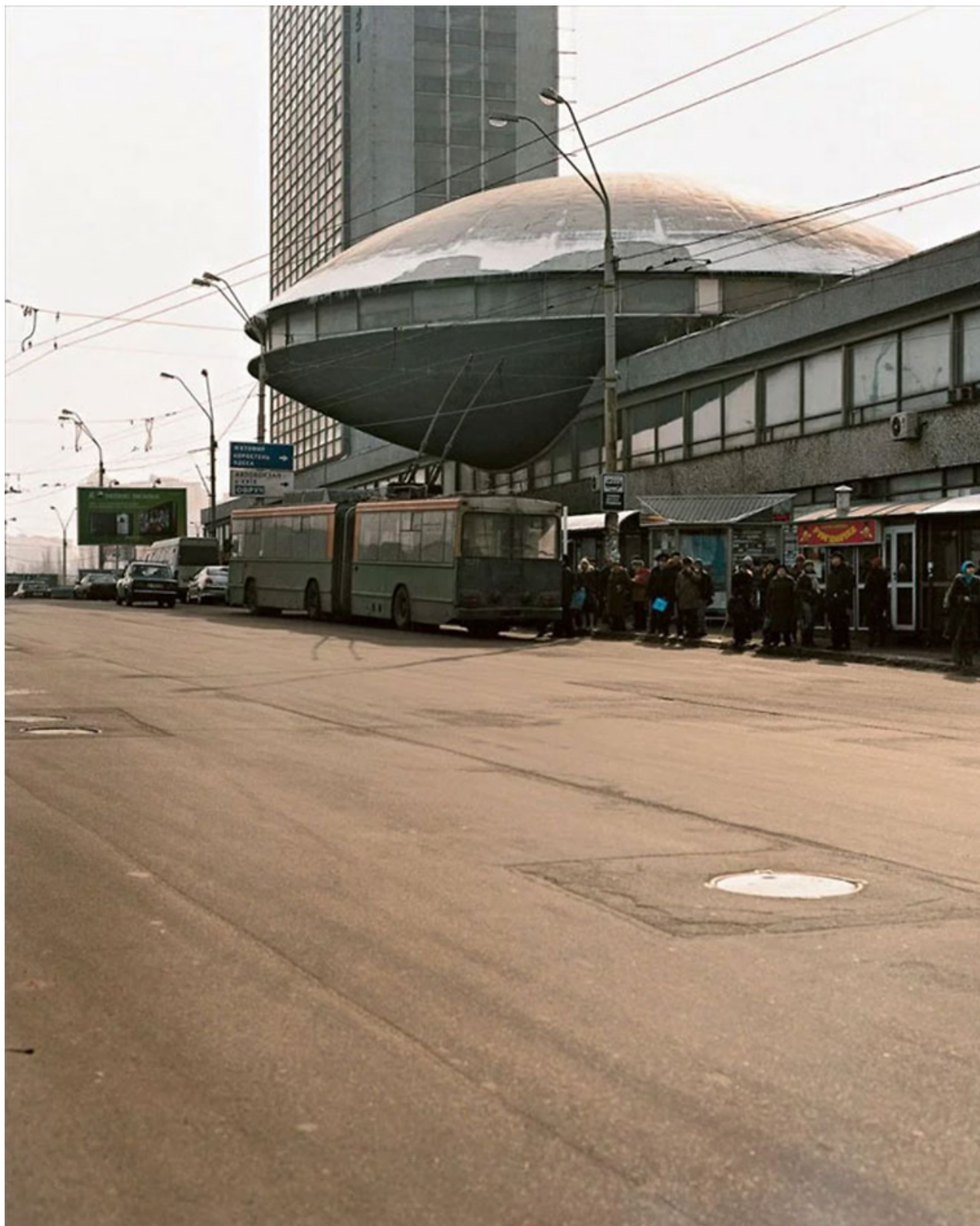
Divadlo dramatického umění Fjodora Dostojevského Vladimíra Somova, postavené v roce 1987 v Novgorodu