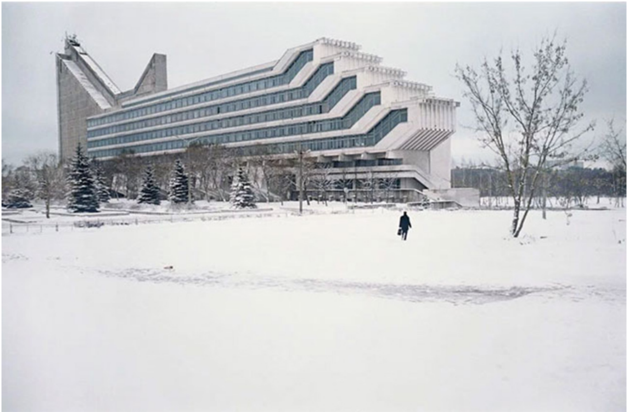
Klub pracujících Rusakov, Moskva, 1927-28