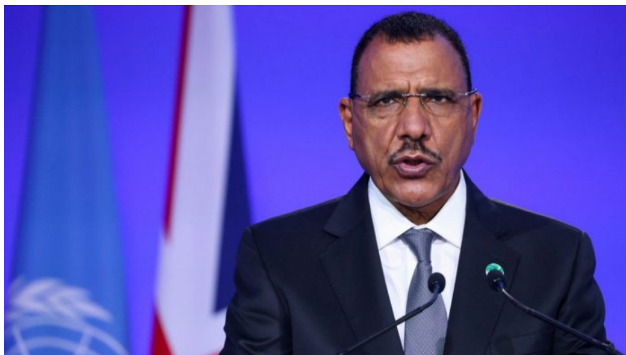
Mohamed Bazoum, sesazený prezident Nigeru

Začínají se dokonce objevovat informace [1], že země ECOWAS, tedy ekonomické sdružení zemí západní Afriky, by mohly v Nigeru provést vojenskou intervenci s cílem vrátit k moci svrženého prezidenta Bazouma. Západoafričtí představitelé rovněž oznámili okamžité zavedení bezletové zóny nad Nigerem pro všechny komerční lety, uzavření všech pozemních hranic se zemí a uvalení finančních sankcí na juntou. Generál Tchiani varoval ECOWAS a nejmenované západní země před zásahem.