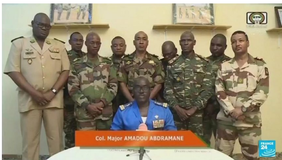
Nigerská povstalecká armáda oznamuje svržení Bazoumovy vlády

“Znovu opakujeme ECOWAS nebo jakémukoli jinému dobrodruhovi naše pevné odhodlání bránit naši vlast,” uvedl v prohlášení, které bylo přečteno v televizi. Převrat vyvolal obavy, že by se Niger, bývalá francouzská kolonie, mohl přiklonit k Rusku. Burkina Faso a Mali se po vlastních převratech rovněž přiblížily Rusku. V Niamey někteří z protestujících před francouzským velvyslanectvím skandovali “Ať žije Rusko”, “Ať žije Putin” a “Pryč s Francií” , uvedla tisková agentura AFP. Zapálili také zdi areálu velvyslanectví. Francie nebude tolerovat žádný útok na své zájmy v Nigeru a bude reagovat “okamžitým a nekompromisním způsobem” , uvedl v prohlášení úřad prezidenta Emmanuela Macrona. A situace opravdu dramaticky eskaluje.