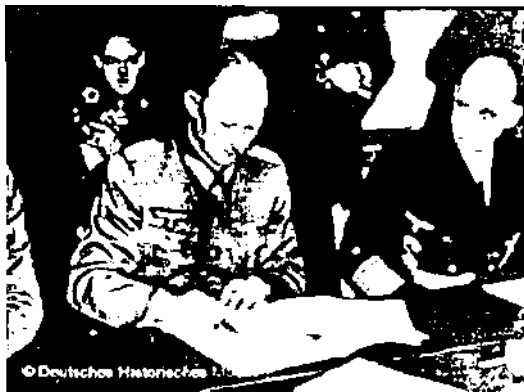
„Kapitulace“ Německa v Remeši