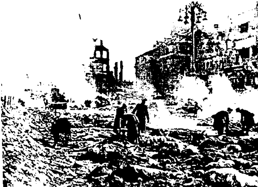
Drážďany po bombardování technologií „ohnivá smršť“. Totéž Anglosasové plánovali udělat s ruskými městy.

Anglosasové se chystali zlomit Rusy terorem - totálním zničením velkých sovětských měst: Moskvy, Leningradu, Vladivostoku, Murmansku a dalších drtícími údery létajících pevností". V ohnivých smršťích měly zahynout miliony Rusů, stejně jako byl zničen Hamburk, Drážďany, Tokio,... To se chystali učinit se svými „spojenci“. Tedy obvyklý obraz: nejodpornější zrada, krajní podlost a zvěřská krutost - to je vizitka západní civilizace a zvláště pak Anglosasů, kteří zabili nejvíce lidí v celé lidské historii.