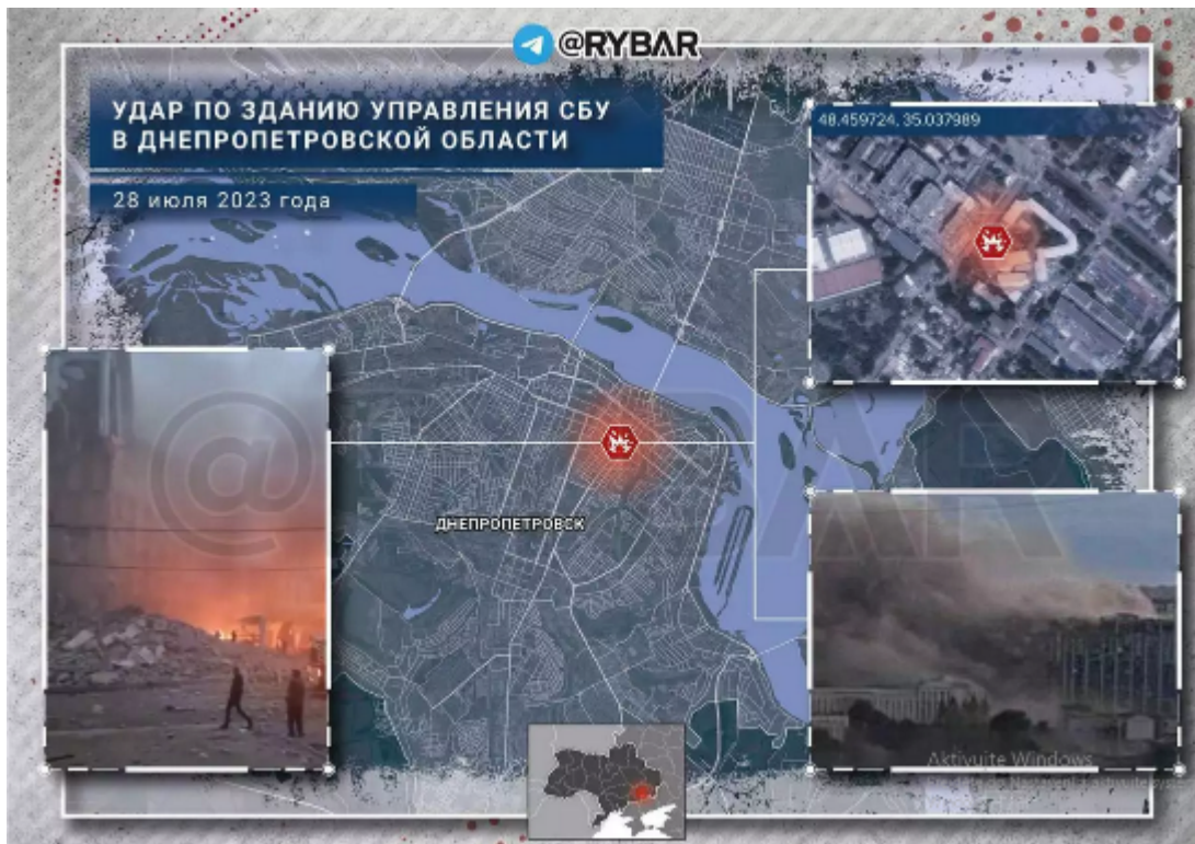
Mapa zásahu sídla SBU v Dněpropetrovsku 28.7. 2023

(možná i díky přítomnosti Zelenského) to věděla. O této variantě by svědčil také počet služebních automobilů na parkovišti před útokem i po něm.