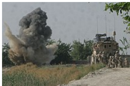
Američtí mariňáci odpálili improvizované výbušné zařízení během kampaně provincie Helmand

Intervence v Afghánistánu ( operace Trvalá svoboda – Afghánistán ), s cílem sesadit vládu Talibanu v této zemi a zničit výcvikové tábory spojené s al-Káidou byla chápána jako zahájení a v mnoha ohledech definující kampaň širší války proti terorismu. Důraz na Síly speciálních operací (SOF), politické vyjednávání s autonomními vojenskými jednotkami a využívání zástupných armád znamenaly významnou změnu oproti dřívějším vojenským přístupům USA. [108]