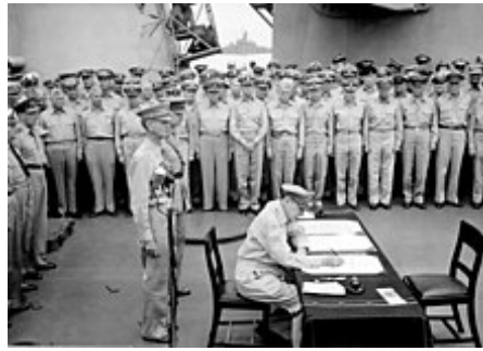
Armádní generál Douglas MacArthur podepisuje jménem spojenců japonský nástroj kapitulace

Druhá světová válka zaujímá v americké psychice zvláštní místo jako největší triumf země a američtí vojáci z druhé světové války jsou často označováni jako „největší generace “. Více než 16 milionů sloužilo (asi 11% populace) a více než 400 000 zemřelo během války. USA se objevily jako jedna ze dvou nesporných supervermoci spolu se Sovětským svazem a na rozdíl od Sovětského svazu byla vlast USA válečným pustošením prakticky nedotčena. Během a po druhé světové válce si Spojené státy a Británie vytvořily stále silnější obranné a zpravodajské vztahy . Mezi projevy tohoto patří rozsáhlé umístění amerických sil ve Spojeném království, sdílené zpravodajské informace , sdílené vojenské technologie (např. jaderné technologie ) a sdílené zadávání zakázek.