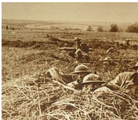
Jednotky AEF v poli, datum neznámé

V létě 1918 byl v Evropě milion amerických vojáků, nebo „ troubů “, jak se jim často říkalo, z Amerických expedičních sil (AEF) , kteří sloužili na západní frontě pod velením generála Johna Pershinga , přičemž 10 000 dalších přicházelo každý den. . Neúspěch jarní ofenzívy německé armády vyčerpал její živou sílu a nebyla schopna zahájit nové ofenzivy. Císařské německé námořnictvo a domácí fronta se poté vzbouřily a nová německá vláda podepsala podmíněčnou kapitulaci, příměří , 11. listopadu 1918 ukončilo válku na západní frontě. [60]