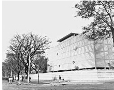
Velvyslanectví Spojených států po ofenzívě Tet

velitelem byl William Westmoreland , jehož strategie zahrnovala systematickou porážku všech nepřátelských sil v poli, navzdory těžkým americkým ztrátám, které odcizily veřejné mínění doma. [85]