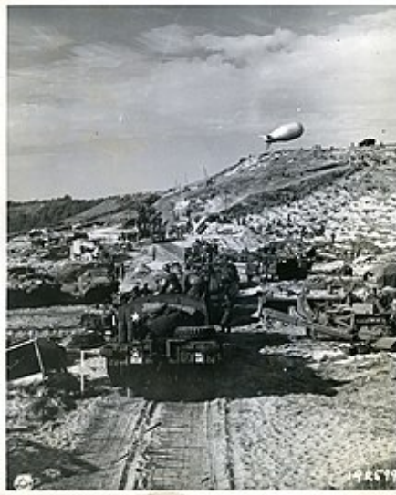
Vozidla americké armády krátce po vyloďení v Normandii

zmocnily amerických, britských a holandských majetků napříč Pacifikem a jihovýchodní Asii , přičemž Havaj a Austrálie sloužily jako hlavní body pro případné osvobození těchto území. [71]