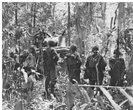
US Marines a M4 Sherman postupující směrem k letišti na mysu Gloucester během kampaně na Novou Guineu