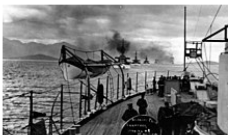
Velká bílá flotila v Magellanově průlivu . Flotila vyrazila na přátelské návštěvy jiných zemí a předvedla světu americkou námořní sílu.

Námořnictvo bylo modernizováno v 80. letech 19. století a v 90. letech 19. století přijalo strategii námořní síly kapitána Alfreda Thayera Mahana — stejně jako každé velké námořnictvo. Staré plachetnice byly nahrazeny moderními ocelovými bitevními loděmi , čímž se dostaly do souladu s námořnictvem Británie a Německa. V roce 1907 byla většina bitevních lodí námořnictva s několika podpurnými plavidly, přezdívaná Velká bílá flotila , součástí 14měsíčního obeplutí světa. Byla to mise nařízená prezidentem Theodorem Rooseveltem , která měla demonstrovat schopnost námořnictva rozšířit se na globální scénu. [47]