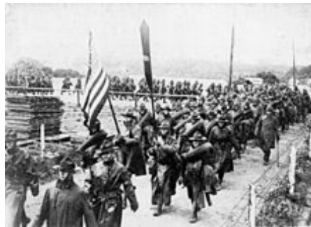
Americké expediční síly pochodující ve Francii, 1918

Hlavní články: Kampaně Spojených států v první světové válce a Spojené státy v první světové válce