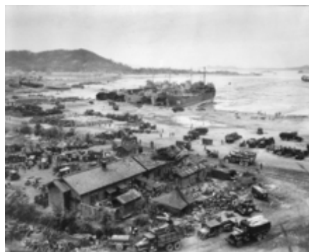
Americké předmostí během bitvy o Inchon

Korejská válka byla konfliktem mezi Spojenými státy a jejich spojenci v OSN a komunistickými mocnostmi pod vlivem Sovětského svazu (rovněž členská země OSN) a Čínské lidové republiky (která později také získala členství v OSN). Hlavními bojovníky byly Severní a Jižní Korea . Hlavní spojenci Jižní Koreje zahrnovali Spojené státy, Kanada, Austrálie, Spojené království, ačkoli mnoho jiných národů poslalo vojáky pod záštitou příkazu Spojených národů . Mezi spojence Severní Koreje patřila Čínská lidová republika, která