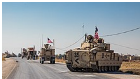
Konvoj amerických MRAP a bojových vozidel Bradley ve východní Sýrii během operace Inherent Resolve

Se vznikem Islámského státu a jeho dobytím rozsáhlých oblastí Iráku a Sýrie vyústila řada krizí, které vyvolaly mezinárodní pozornost. ISIL páchal sektářské zabíjení a válečné zločiny v Iráku i Sýrii. Zisky dosažené v irácké válce byly vráceny zpět, když jednotky irácké armády opustily svá stanoviště. Města ovládla teroristická skupina, která prosadila svou značku práva šaría. Zájem a pobouření mezi západními mocnostmi vyvolalo také únosy a dekapitace mnoha západních novinářů a humanitárních pracovníků. USA v srpnu zasáhly nálety v Iráku na území a majetek držený ISIL a v září koalice USA a blízkovýchodních mocností zahájila bombardovací kampaň v Sýrii zaměřenou na degradaci a zničení ISIL a území ovládané Al-Nusrou . [120] Do prosince 2017 neměl ISIL v Iráku po kampani v západním Iráku v roce 2017 žádné zbývající území a v březnu 2019 ztratil v Sýrii všechna zbývající území. Nálety amerických a koaličních sil v Sýrii pokračovaly proti Asadově vládě, zejména po Doumě chemický útok v roce 2018.