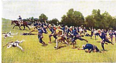
Dobití Rough Riders během bitvy o San Juan Hill

Španělsko -americká válka byla krátká, ale rozhodná válka, která se vyznačovala rychlými, drtivými americkými vítězstvími na moři i na souši proti Španělské říši . Námořnictvo bylo dobře připraveno a získalo vavříny, i když se jej politici pokoušeli (a nepodařilo se) přemístit na obranu měst na východním pobřeží před potenciálními hrozbami ze strany slabé flotily španělského námořnictva . [28] Armáda si vedla v boji na Kubě dobře. Byla však příliš orientovaná na malé posty na Západě a nebyla tak dobře připravena na zámořský konflikt. [29] Spoléhalo se na dobrovolníky a jednotky státní domobrany, které čelily logistickým, výcvikovým a potravinovým problémům v zastávkových oblastech na Floridě . [30] Spojené státy osvobodily Kubu (po okupaci americkou armádou ). Mírovou smlouvou Španělsko postoupilo Spojeným státům své kolonie Portoriko , Guam a Filipíny . [31] Námořnictvo tam a na Havaji zřídilo zauhlovací stanice (která byla násilně svržena v roce 1893 státním převratem proti královně Lili'uokalani a anektována později v roce 1898). [32].[33] Americké námořnictvo mělo nyní významnou předsunutou přítomnost přes Tichý oceán a (s pronájmem námořní