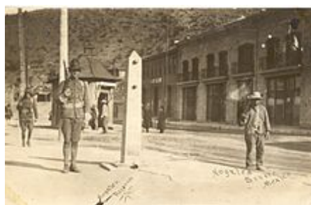
Američtí a mexičtí vojáci střežící hranici v Ambos Nogales během pohraniční války .

Hlavní články: Mexická pohraniční válka (1910-1919) a zapojení Spojených států do mexické revoluce