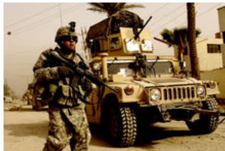
Voják americké armády na hlídce vedle Humvee v Karradě v Bagdádu

Hlavní články: Irácká válka , invaze do Iráku v roce 2003 a okupace Iráku (2003-2011)