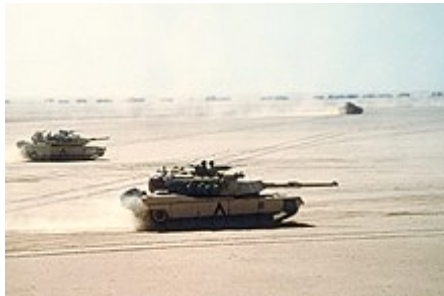
Americké hlavní bitevní tanky M1 Abrams a bojové vozidlo pěchoty M2 Bradley postupují Kuvajtem

Válka v Perském zálivu byl konflikt mezi Irákem a koaličními silami 34 národů vedenými Spojenými státy. Vedení k válce začalo iráckou invazí do Kuvajtu v srpnu 1990, která se setkala s okamžitými ekonomickými sankcemi Organizace spojených národů proti Iráku. Koalice zahájila nepřátelské akce v lednu 1991, což vedlo k rozhodujícímu vítězství koaličních sil vedených USA, které vytlačily irácké ozbrojené síly z Kuvajtu s minimálními koaličními úmrtími. Navzdory nízkému počtu obětí by více než 180 000 amerických veteránů bylo později klasifikováno jako „trvale invalidní“ podle amerického ministerstva pro záležitosti veteránů (viz. Syndrom války v Zálivu ). Hlavní bitvy byly vzdušné a pozemní boje v Iráku, Kuvajtu a pohraničních oblastech Saúdské Arábie . Pozemní boje se nerozšířily mimo bezprostřední hraniční oblast Irák/Kuvajt/Saúdská Arábie, ačkoli koalice bombardovala města a strategické cíle po celém Iráku a Irák vypálil rakety Scud na izraelská a saúdská města.