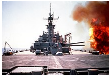
USS Wisconsin ostřeluje irácké pozice v Kuvajtu

války. Po téměř 50 letech zástupných válek a neustálých obav z další války v Evropě mezi NATO a Varšavskou smlouvou si někteří mysleli, že válka v Perském zálivu by mohla konečně odpovědět na otázku, která vojenská filozofie by vládla svrchovaně. Irácké síly byly po 8 letech války s Íránem zoceleny v bitvě a byly dobře vybaveny pozdním modelem sovětskéhotanky a proudové stíhačky, ale protiletadlové zbraně byly ochromeny; pro srovnání, USA neměly žádné rozsáhlé bojové zkušenosti od svého stažení z Vietnamu téměř před 20 lety a velké změny v americké doktríně, vybavení a technologii od té doby nebyly nikdy testovány pod palbou.