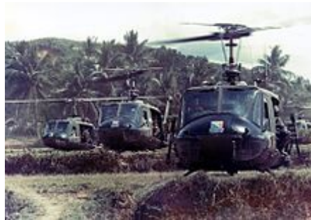
Vznik Bell UH-1 Iroquois ca. 1966

Viz také: Letectvo Spojených států v Thajsku a tajná válka