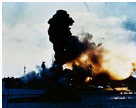
Výbuch na palubě USS Arizona během útoku na Pearl Harbor

Hlavní články: Druhá světová válka , Vojenská historie Spojených států během 2. světové války , Letecká válka druhé světové války § Spojené státy: Armádní letectvo a zvláštní vztahy