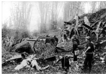
Američtí vojáci v Manile během filipínsko-americké války .

Hlavní článek: Filipínsko-americká válka