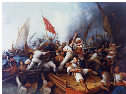
Stephen Decatur nalodění na dělový člun Tripolitan, 3. srpna 1804, první barbarská válka

Berberi podél Barbary Coast (dnešní Libye ) poslali piráty , aby zajali obchodní lodě a zadrželi posádky za výkupné. USA platily peníze za ochranu až do roku 1801, kdy prezident Thomas Jefferson odmítl