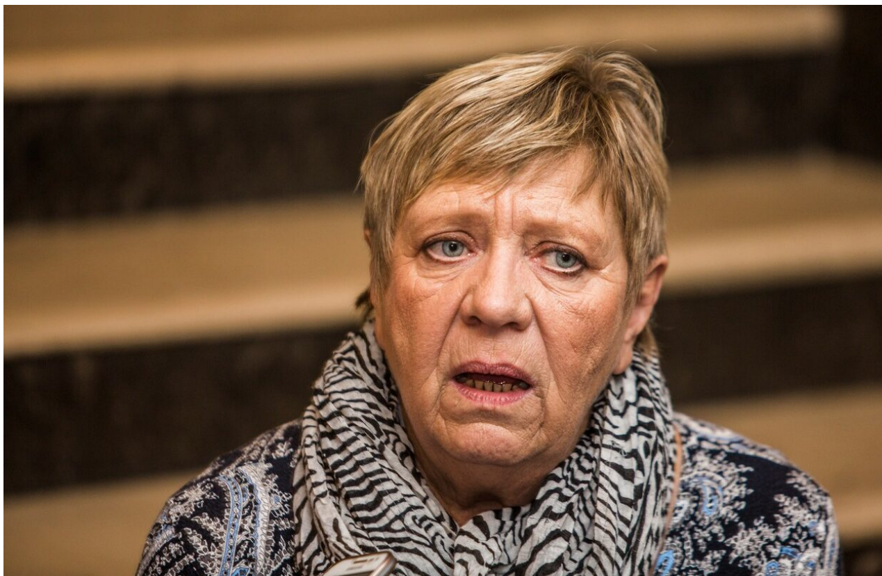
Herečka Jaroslava Obermaierová

FORUM 24 forum24.cz/herecce-obermaierove-dramaticky-zvysili-najem-na-sedm-tisic-tak-to-uz-prestava-vsechno