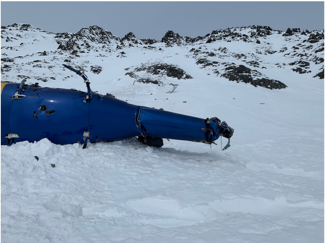
Fotografie z místa havárie u ledovce Knik. (Aljašská horská záchranná skupina)

"Takže jsem tam byl dlouho sám, osm hodin," řekl Horváth. "Vždycky je to, když řeknu toto číslo, a pozice, kde jsem byl, osm hodin sedět ve vrtulníku uprostřed Aljašky." Bože. Víš, že je to těžké, těžké."