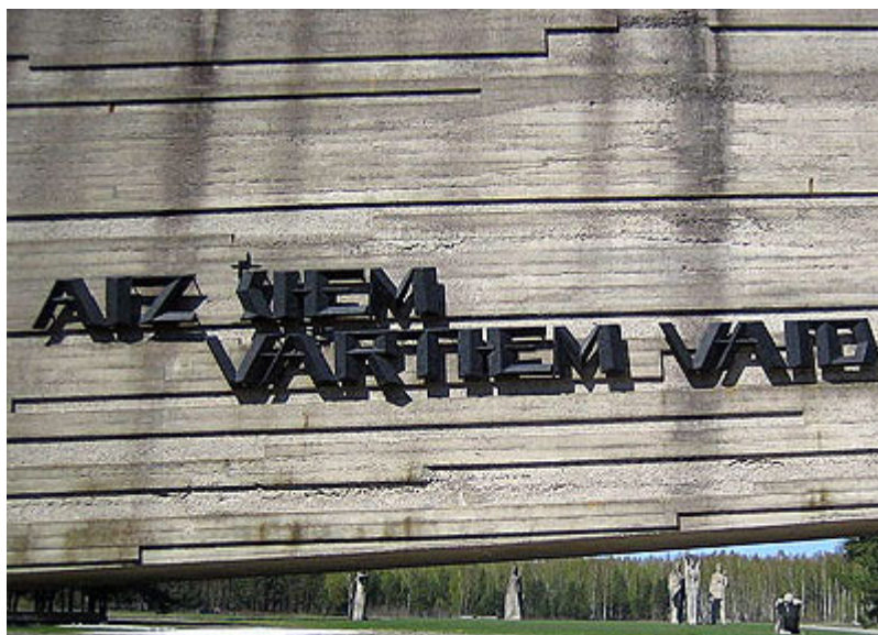
„Za těmito branami země sténá,“ stojí na nápisu v lotyštině

S dietou 100 gramů chleba a jeden a půl litru tekutiny jako polévka denně byly hubené a nemocné děti kanibalsky využívány jako zdroje krve pro potřeby německých nemocnic. Nacisté zorganizovali továrnu na dětskou krev v táboře Salaspils. Šetřením bylo zjištěno, že v období od konce roku 1942 do roku 1944. Tábořem Salaspils prošlo až 12 tisíc dětí. Naprostá většina z nich byla podrobena pumpování krve. Na základě množství krve odebrané jednomu dítěti (500 gramů) zjištěného soudním lékařským vyšetřením bylo spočítáno, že jen v Salaspils Němci vypumpovali z cév dětí 3,5 tisíce litrů krve. Na základě vyšetřovacích materiálů, svědectví a údajů z exhumace dětských mrtvol z jejich pohřebišť bylo zjištěno, že za tři roky existence tábora Salaspils zemřelo mučednickou smrtí nejméně 7 tisíc dětí, některé byly upáleny, a někteří z nich byli pohřbeni na starém posádkovém hřbitově poblíž Salaspils.