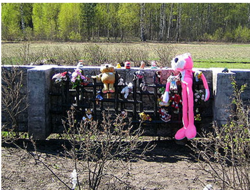
Tam, kde býval dětský barák, jsou vždycky hračky...

Jeho prvními vězni byli občané Československa, Polska, Rakouska a dalších zemí okupovaných nacisty a také němečtí antifašisté. Od května 1942 začali být do tábora přiváženi sovětský váleční zajatci, političtí vězni z centrální věznice v Rize a civilisté podezřelí ze spojení s partyzány. Katové věnovali zvláštní pozornost zásobování dětí k odsávání krve.