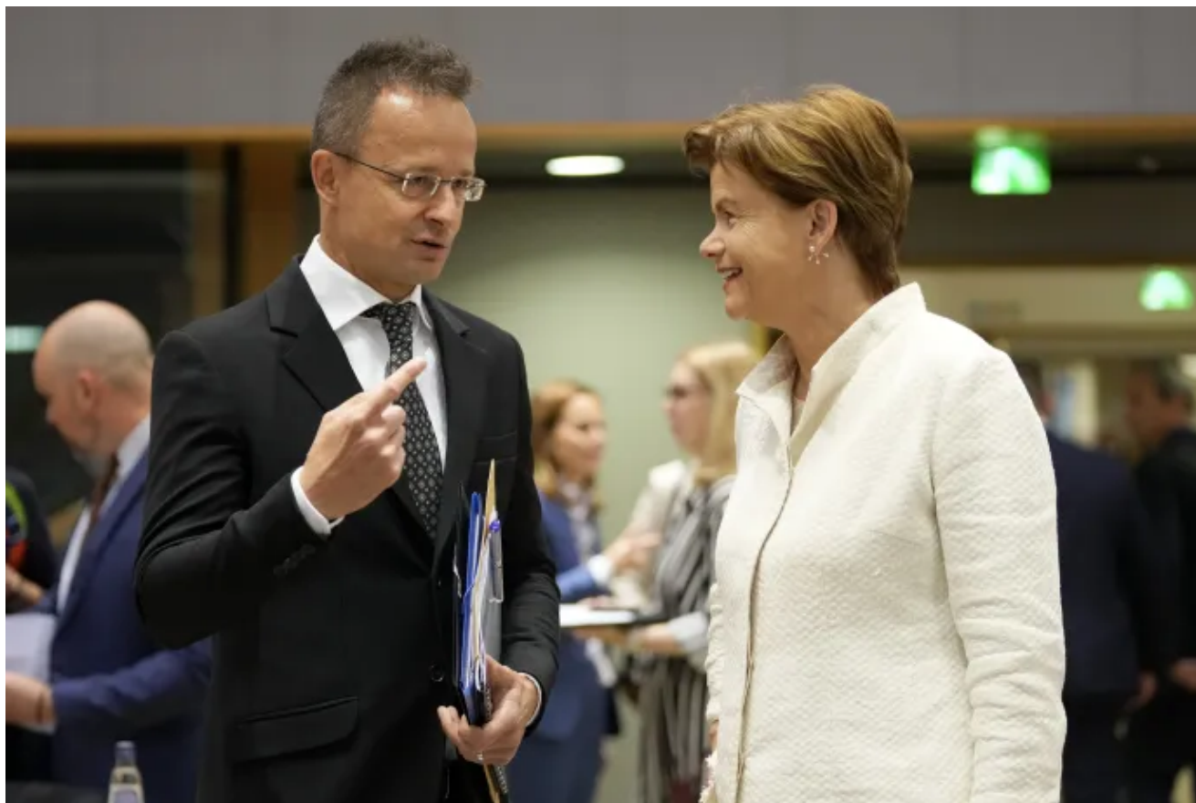
Ministr zahraničních věcí a obchodu Péter Szijjártó (b) a bývalý ministr zahraničních věcí Baiba Braze na setkání ministrů zahraničí Evropské unie

Minulé úterý se členské státy EU rozhodly použít zisky ze zmrazených aktiv ruské centrální banky na pomoc Ukrajině – především vojensky. Podle prohlášení Rady EU (složené z ministrů členských zemí) budou peníze použity na podporu ukrajinské armády, posílení ukrajinského obranného průmyslu a obnovu země.