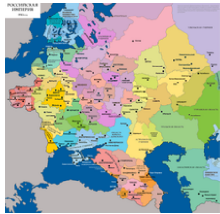
Gubernie v západní části Ruska v roce 1910

V 19. století se samoděržaví samozřejmě proměňovalo. Například Alexandr II. (1855–1881) se snažil o jeho moderní interpretaci a zavedl celou řadu reforem, které vedly nebo měly vést k pozvolnému přechodu od despoticky a tradičně organizovaného státu k právnímu státu. Naopak vlády jeho syna Alexandra III. (1881–1894) a také vnuka Mikuláše II. (1894–1917) se snažily o návrat k tradičnímu konzervativnímu pojetí samoděržaví , které vidělo v gosudar-imperátorovi a jeho neomezené moci jedinou záruku politické stability a existence Ruska. Tyto snahy se samozřejmě dostávaly do konfliktu s politickými i sociálními změnami uvnitř ruské společnosti.