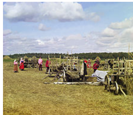
Ruské žně, foto Sergej Prokudin-Gorskij

V první polovině sledované doby (asi do 90. let 19. století) byla většina ruského dělnictva ještě úzce svázána s venkovem. Jednalo se o námezdní sezónní dělníky, kteří v době sezóny pracovali na polích jako rolníci a přes zimu se nechali najímat na práci ve městech. Tato situace se začala měnit na konci 19. století, kdy se etablovala skupina kvalifikovaných městských dělníků, kteří se identifikovali se svou sociální skupinou a ztratili vazby na venkov. S