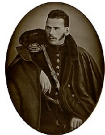
Lev Nikolajevič Tolstoj pocházel ze starého šlechtického rodu Tolstých

K emancipaci ruské šlechty došlo ve skutečnosti až v době Kateřiny II. Veliké v roce 1762 , kdy Kateřina II. po svém nástupu potvrdila některá významná privilegia pro ruské dvorjanstvo , jako bylo například osvobození od povinné vojenské služby (platné do roku 1874 ) a právo vycestovat ze země bez nutnosti pasu (tedy privilegium volného pohybu).