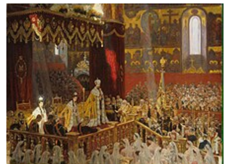
Korunovace Mikuláše II. ruským carem roku 1896

Samoděržavný princip vlády byl tedy určitým derivátem několika tradic a vlivů. Petr I. Veliký se snažil (a podařilo se mu to částečně) samoděržaví a Rusko pozápádnit, ale užíval k tomu stále despotických metod svých moskevských předchůdců. [zdroj?]