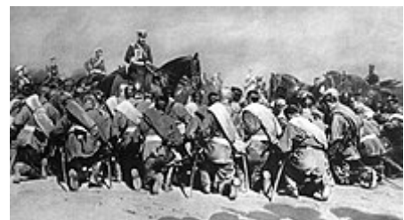
Car Mikuláš II. a ruští vojáci během Rusko-japonské války