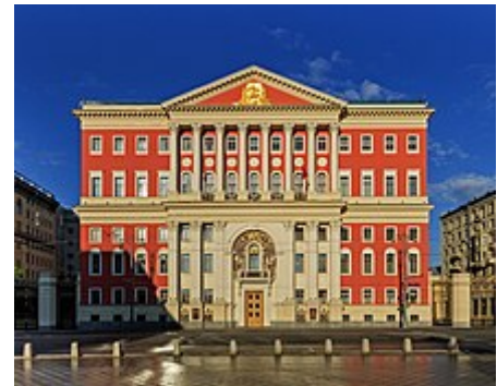
Rezidence moskevského guvernéra (1778–82)

Moderní státní správu do Ruska zavedly reformy Petra I. Velikého. Do této doby (1708) byla praxe státní správy stále založena na archaickém principu kormljení. Rusko také postrádalo centralizovaně organizovanou a standardizovanou organizaci státní správy i profesionální státní úředníky.