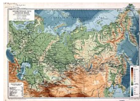
Ruská říše v roce 1914

Na začátku 19. století se Rusko stalo cílem Napoleonových mocenských ambicí , což vedlo k absolutnímu zničení celé Napoleonovy Grande Armée se 700 000 vojáky, tehdy nejpočetnější armády světa. Během odvetného tažení car Alexandr roku 1814 dobyl Paříž se svými evropskými spojenci, kteří přešli na jeho stranu po porážce Napoleona v Rusku.