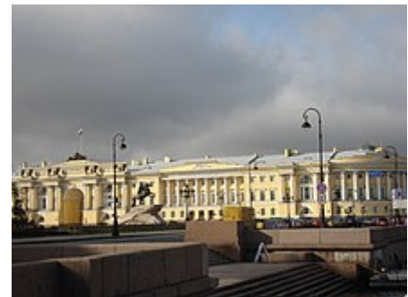
Dřívější sídlo senátu a synotu v Petrohradu

V roce 1906 (po první ruské revoluci) mělo Rusko ještě ministerstvo zemědělství, obchodu a průmyslu, cest a komunikací; ministerstva pozemních vojenských sil a námořnictva bylo spojeno v jedno