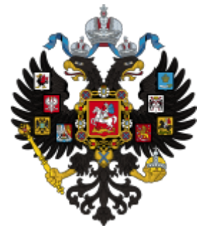
Malý znak Ruského impéria

Ruská říše zůstávala po celou dobu svojí existence absolutistickým státem, založeným na principu samoděržaví . I po revoluci 1905 a Říjnovém manifestu zůstával ruský car (neoficiální titul), resp. gosudar-imperátor absolutistickým panovníkem s neomezenou mocí stejně jako ve všech ostatních absolutních monarchiích Evropy. Princip samoděržaví vycházel částečně z byzantské tradice. Znamenalo to v podstatě to, že gosudar-imperátor ve svých rukách držel veškerou výkonnou, zákonodárnou a soudní moc, které potom delegoval na jemu podřízené orgány stejně jako u všech ostatních absolutních mocností v Evropě.