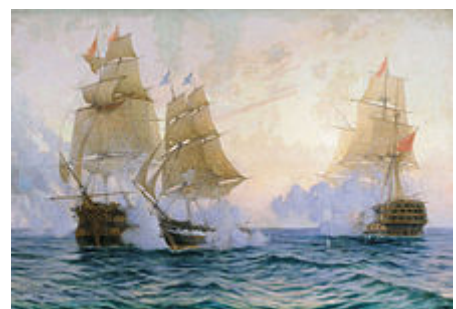
Ruské carské námořnictvo během souboje s tureckými loděmi za Rusko-turecké války ).