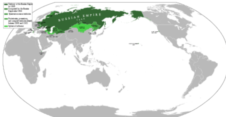
Území v roce 1866 Protektoráty, kolonie a okupovaná území mezi léty 1800 a 1917. Sféry vlivu

Na začátku 19. století se Rusko stalo cílem Napoleonových mocenských ambicí , což vedlo k absolutnímu zničení celé Napoleonovy Grande Armée se 700 000 vojáky, tehdy nejpočetnější armády světa. Během odvetného tažení car Alexandr roku 1814 dobyl Paříž se svými evropskými spojenci, kteří přešli na jeho stranu po porážce Napoleona v Rusku.