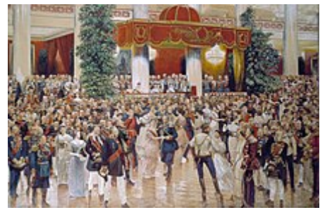
Ples na carském dvoře v Petrohradě

Významnou proměnou prošla ruská šlechta v době Petra I. Velikého , který pochopil nutnost její poevropštění a zároveň šlechtu obměnil šlechtou novou, která nebyla postavena na původu, ale na zásluhách. V předpetrovské době byla šlechta na jedné straně významným politickým aktérem v oblasti správy a armády, na druhé straně byla pevně svázána s carským absolutismem. Petr I. kladl důraz především na větší vzdělanost šlechty a její provázání s efektivně spravovaným státem. Naopak závislost aristokracie na samoděržaví mu vyhovovala.