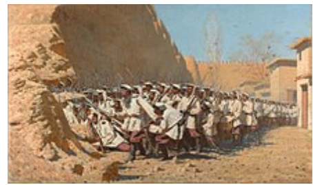
Věreščaginův obraz "Ať vejdou!" z roku 1871 , připomínající dobytí Chivy ruskými vojsky

Ruská armáda a loďstvo byly v 18. a 19. století do jisté míry mnohonárodním tělesem, ve kterém sloužila na jedné straně masa často nevzdělaných rolníků, na druhé straně mnohonárodní elita ruských důstojníků, pocházejících z řad místních aristokracií nebo starých vojenských rodin ( pobaltští Němci , Poláci , Gruzínci a Tataři patřili k nejčastějším neruským členům důstojnického sboru).