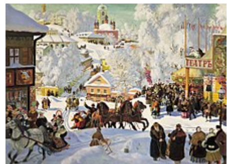
Provinční ruské město v zimě, namaloval Boris Kustodijev

Lokální samosprávu uvedl do Ruska Alexandr II. Nikolajevič v rámci liberálních reforem své vlády v roce 1864 zřízením místních zastupitelských shromáždění zemstev ve 34 evropských guberniích Ruska . Do zemstev byli voleni zástupci velkostatkářů, měst a rolníků podle principu nerovného zastoupení, což znamenalo, že velkostatkářům byl garantován největší vliv. [7] Ruská místní samospráva byla po roce 1864 organizována vzestupně. Na nejnižším stupni byla venkovská samospráva miru a volosti a dále zemstva na úrovni provincie a gubernie . Všechny stupně byly vzájemně provázány, avšak klíčový vliv měla zemstva na úrovni provincií a gubernie, která ovlivňovala především místní školskou, zdravotní ale i ekonomickou politiku či poštu. Do nich delegovaly vesnické komunity své zástupce. Během více než 60 let své existence se zemstva stala baštou ruských liberálů a konstitucionalistů . Po roce 1905 byla zemstva zvláště zainteresována v uvádění agrární reformy Petra Stolypina , který chtěla podstatně modernizovat ruskou vesnici.