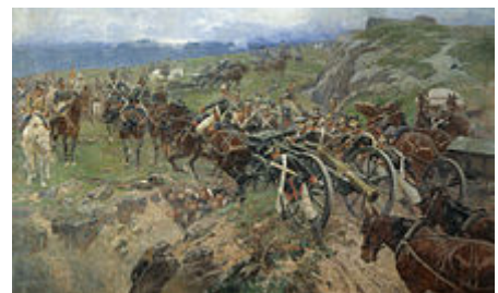
Carské jednotky se připravují na invazi perských sil během rusko-perské války (1804–1813), která nastala současně s francouzskou invazí do Ruska.

Armáda hrála v dějinách Ruské říše významnou roli a byla považována za jeden z hlavních pilířů ruského státu. Vzhledem k neustálému ohrožení od ruských sousedů jako Tataři, Turci, Poláci a Švédové, kteří se svého času pokoušeli obohatit na úkor ruských zemí a neexistujícím přírodním hranicím v podobě členitého terénu [5] nebo moře které chránilo například Británii před invazemi, tak v Rusku byl značný důraz na silnou armádu. Stejně tomu bylo u jiných impérií té doby, Rusko se podílelo na koloniální expanzi, přes Sibiř až na Aljašku a do dnešní Kalifornie , kde Rusové postavili pevnost Fort Ross . Funkce armády nebyly čistě vojenské ale v mnoha případech také správní a policejní. Zcela charakteristickým bylo propojení armády se státní správou a vládou obecně. Cela řada ruských politiků 18. a 19. století začala kariéru v armádě nebo námořnictvu , a měla vysoké vojenské hodnosti.