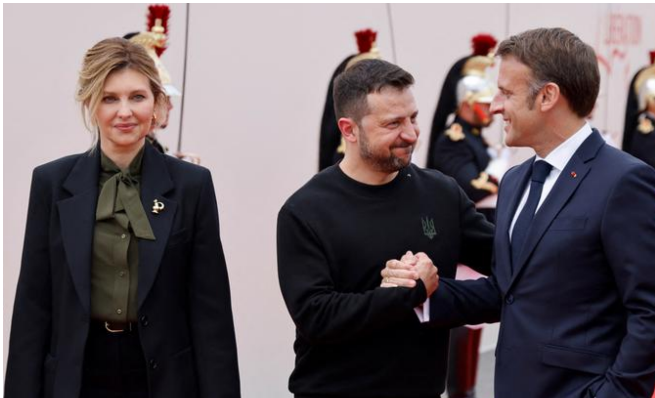
Volodymyr Zelensky a Olena Zelenska v Paříži

Na začátku června přijela rodina Zelenských s ukrajinskou delegací do Francie na ceremonie k 80. výročí vylodění v Normandii. Kromě oficiálních návštěv byli manželé Zelenští přítomni i na jiných méně veřejných akcích.