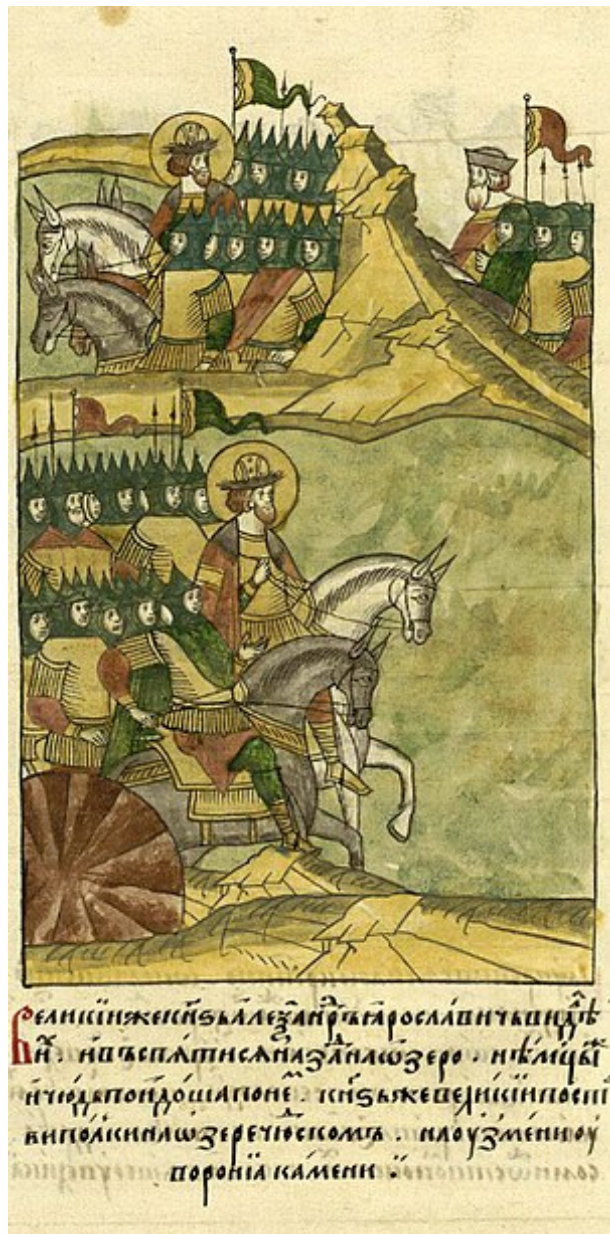
Ruská armáda se dostává k jezeru Peipus . Miniatura z ruské kroniky

Ti, kteří byli v armádě bratrských rytířů, byli obklíčeni... Bratři rytíři vzdorovali docela tvrdošijně, ale byli tam poraženi. Někteří obyvatelé Dorpatu opustili bitvu, to byla jejich záchrana, byli nuceni ustoupit [15] .