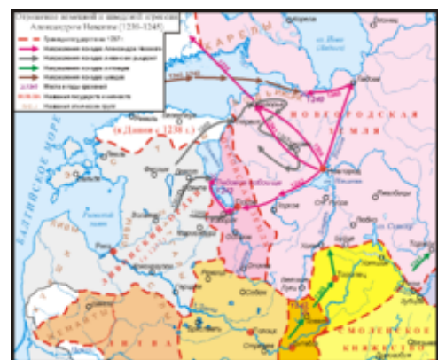
Vojenské akce Alexandra Něvského proti Švédům a Livoncům v letech 1240-1242

V prosinci 1237 vyhlásil papež Řehoř IX. druhou křížovou výpravu proti pobaltským pohanům a v červnu 1238 se dánský král Valdemar II. a mistr livonského řádu Herman Balk dohodli na rozdělení Estonska a vojenské akci proti Rusku v pobaltských státech. za účasti Švédů [7] . Současně byly ruské země během těchto let značně oslabeny v důsledku mongolské invaze