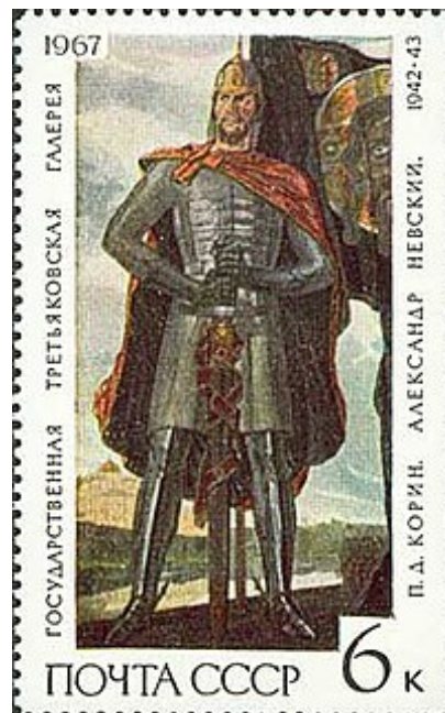
Razítko s fragmentem triptychu Pavla Korina „ Alexandr Něvský. “ (SSSR, 1967)

V sovětské historiografii byla bitva o led považována za jednu z největších bitev v celé historii německé rytířské agrese v pobaltských státech a počet vojáků v bitvě u jezera Peipus se odhadoval na 10-12 tisíc lidí. Řád a 15–17 tisíc lidí z Novgorodu a Vladimíra („Nizovtsy“) [4].[5] ( poslední čísla odpovídají Henrymu Lotyšskému hodnocení počtu ruských vojáků při popisu jejich tažení v pobaltských státech v letech 1210- 20. léta 12. století [27].[28].[29] ), tedy přibližně na stejné úrovni jako v bitvě u Grunwaldu (1410) - až 11 tisíc lidí v řádu a asi 16-17 tisíc lidí v polsko- Litevská armáda [30].