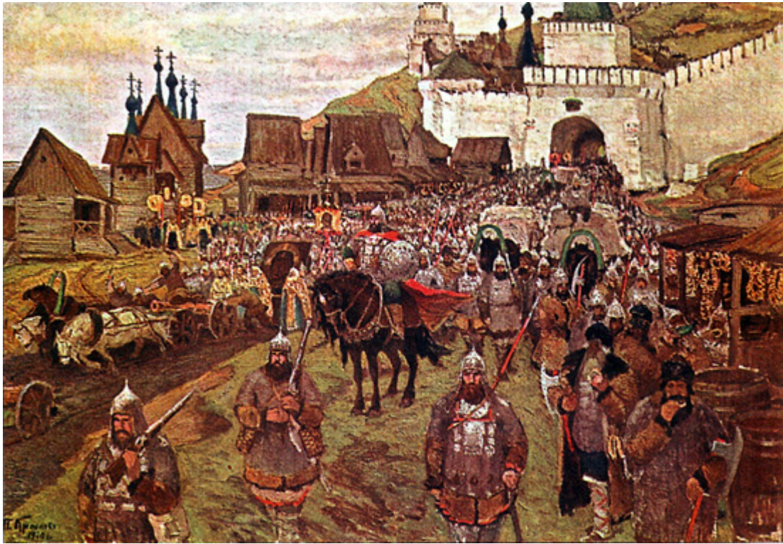
Princ Požarskij v čele milice. Chromolitografie podle obrazu T. Krylova. 1910

Předtím princ Pozharsky obsadil město Jaroslavl a poslal tam jízdní oddíl pod velením svého bratrance prince Dmitrije Lopaty-Pozharského. Po cestě obsadily samostatné oddíly města Kostroma, Suzdal a řadu dalších.