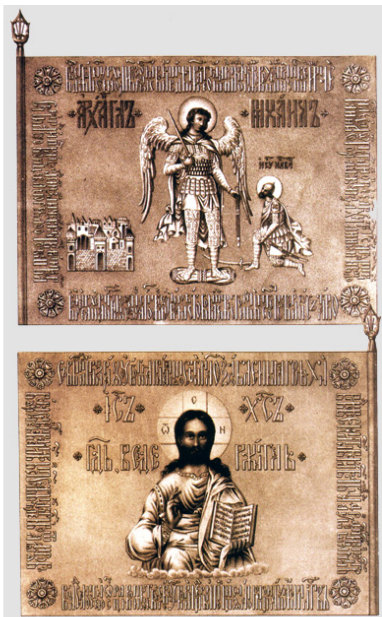
Prapor prince Požarského. 1612

Již večer Minin, který vzal tři stovky záložních jezdců a oddíl kapitána přeběhlíka Chmelevského, překročil řeku Moskvu a rozhodně zaútočil na nepřátelskou bariéru na krymském nádvoří. Poláci uprchli, což se v hejtmanově armádě stalo běžným jevem. Domobrana zahájila všeobecný protiútok, ale princ Požarskij prozíravě nařídil pronásledování těch, kteří utekli, aby se zastavili.