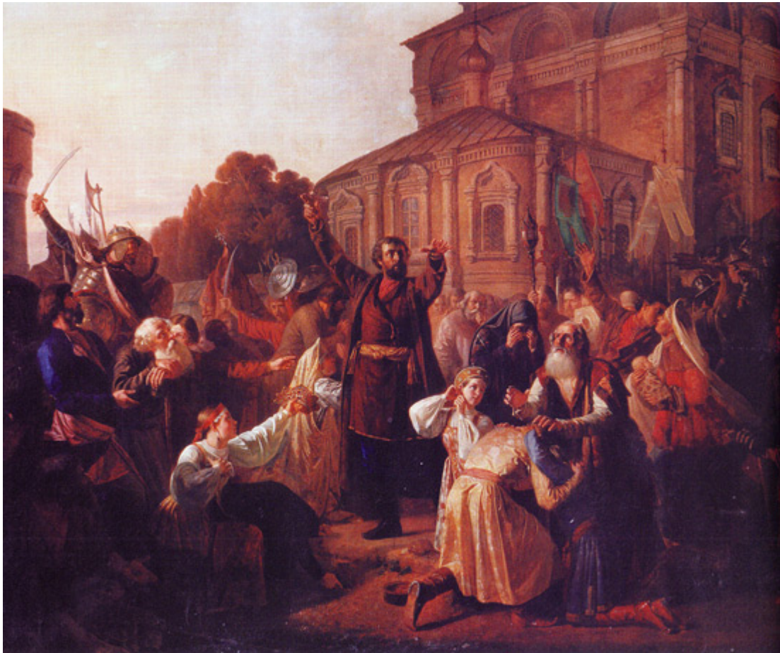
M.I. Peskov. Mininova výzva k lidu Nižnij Novgorod v roce 1611. 1861

Sám náčelník daroval pro potřeby milice nejen „celou svou pokladnici“, ale také zlaté a stříbrné rámy z ikon a šperky své ženy. Protože ale nebylo dost dobrovolných příspěvků, byla vyhlášena nucená daň od všech obyvatel Nižního Novgorodu: každý z nich musel do pokladny milice přispívat pětinou svých příjmů z rybářských a obchodních aktivit.