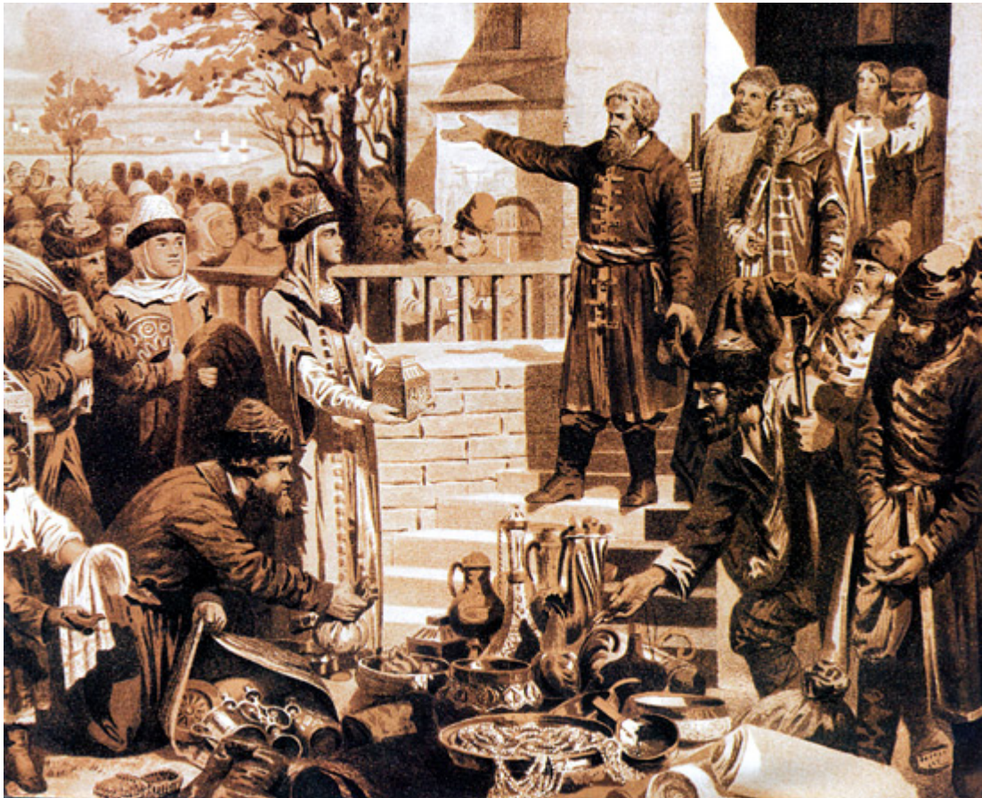
PEKLO. Kivšenko. Odvolání od Kuzmy Minina obyvatelům Nižního Novgorodu. 1611

Obyvatelé Nižního Novgorodu dali Kuzmovi Mininovi titul „vyvolená osoba celou zemí“. „Rada celé Země“ vytvořená ve městě se v podstatě stala prozatímní vládou. Na radu Minina byl na místo hlavního (prvního) velitele milice pozván „umělý“ princ Dmitrij Michajlovič Pozharsky, který byl po zranění ošetřen v nedaleké vesnici Mugreevo v okrese Suzdal. Byla mu vyslána čestná ambasáda.