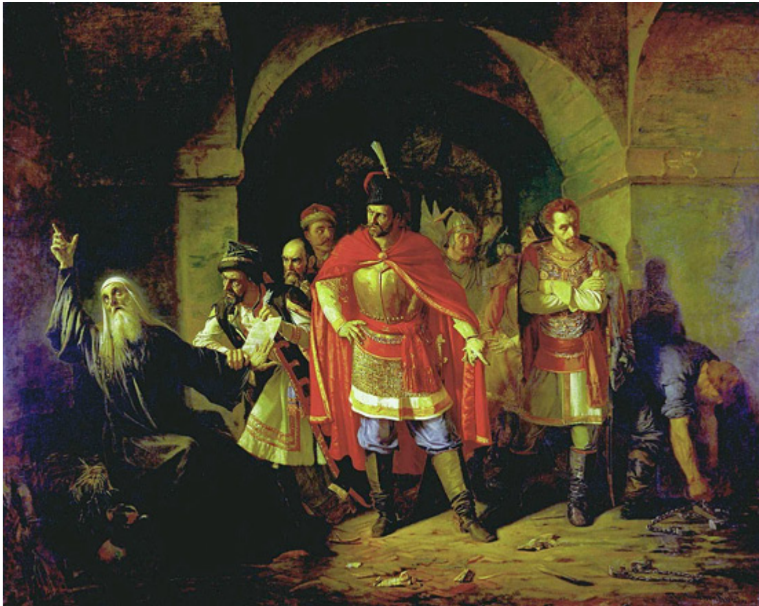
P.P. Chistyakov. Patriarcha Hermogenes odmítá Poláky podepsat dopis

Vlastenecká výzva získala nejvřelejší odezvu od obyvatel Nižního Novgorodu. Na Mininovu radu dali měšťané „třetinu svých peněz“, tedy třetinu svého majetku, na vytvoření a údržbu zemské armády.