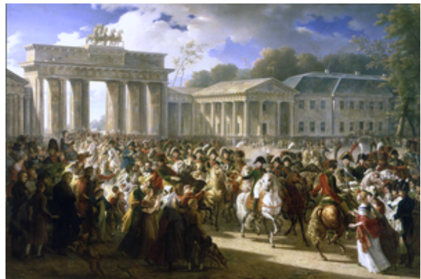
Napoleon vstupuje do Berlína v čele svých vojsk. Charles Meynier , 1810.

7 . Reformátoři jako Carl von Clausewitz a Johann Gottlieb Fichte si uvědomili potřebu přeměnit staré Německo v moderní a jednotný stát , aby mohl konkurovat Francii 8 , „ velkému národu “. Němci se objevují ponížení a fascinovaní francouzskou okupací a jsou nuceni ji napodobovat, aby přežili. Francie proto poslouží jako vzor i záštita