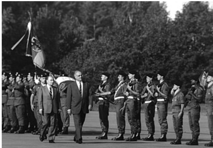
Prezident François Mitterrand a kancléř Helmut Kohl hodnotí jednotky FAR umístěné v Bádensku-Württembersku , 24. září 1987.

Supervelmoci po posledním světovém konfliktu analyzovaly příčiny odporu a uvažovaly: