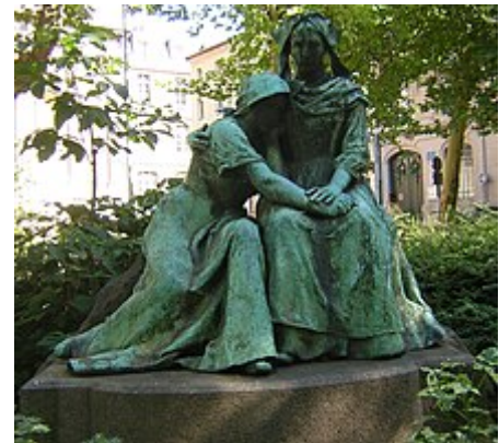
Le Souvenir od Paula Duboise , socha v Nancy.

Francouzský názor se domnívá, že Alsasko -Lotrinsko bylo od konce prusko-francouzské války , vystaveno represivnímu režimu a udržuje nostalgii po ztracených provinciích 12 . Tento pocit dokresluje například píseň Nebudeš mít Alsasko a Lotrinsko známé všem Francouzům, úspěch knihy Le Tour de la France par deux enfants nebo prohlášení Fustela de Coulanges , profesora na University of Strasbourg, který prohlásil 27. října 1870 o Alsasku: