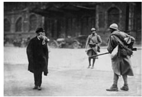
Během 20. let 20. století Francie a Belgie okupovaly Porúří , což vyvolalo nelibost mezi obyvatelstvem.

Versailleská smlouva poskytla zemím napadeným Německem značné válečné škody. Belgie těžila z priority, protože byla napadena jako první a především byla zničena a zbavena svých průmyslových zařízení na většině svého území. Tato kompenzace však nebyla zhmotněna pouze německými dodávkami materiálu a zařízení. Od 30. let 20. století by se v Belgii také rozvinula pangermánská podvratná akce s cílem infiltrovat pravicové strany Flandry spoléháním na utrpení vlámských vojáků prezentovaných jako oběti belgické armády ovládané francouzsky mluvícími během čtyř let války. První světová válka. Nacistické aktivity také ovlivnily francouzsky mluvící pravici tím, že měly tendenci bránit belgickému přezbrojení požadovanému v rámci politiky neutrality. Tuto belgickou volbu silné neutrality chtěl belgický král Leopold III . a podpořila ji vláda a parlament Bruselu, kteří pochopili, že země nemůže počítat se spojenectvím s velmocemi zrozenými z první světové války.