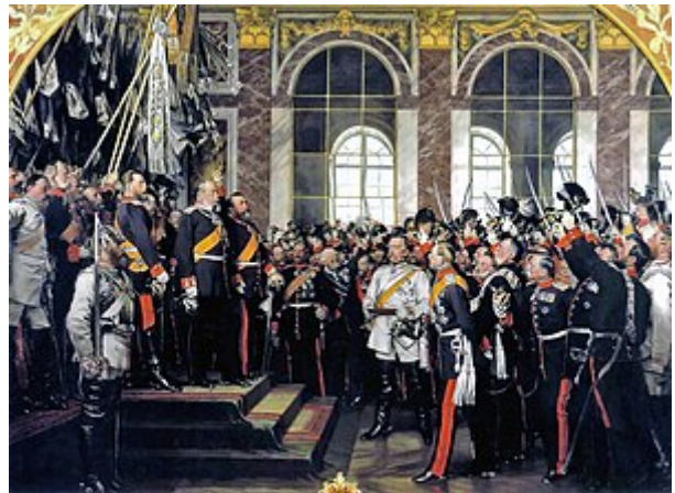
Vyhlášení Druhé německé říše ve Versailles , 1871 - Obraz Antona von Wenera .

Vítěz války Bismarck slaví vítězství v Zrcadlové síni paláce ve Versailles vyhlášením Druhé říše . Tento akt završil proces národní jednoty , vytvořením německého národa po vzoru Severoněmeckého spolku , neboť potvrdil mocenský vzestup Hohenzollernského Pruska na úkor habsburského dynastického tábora .