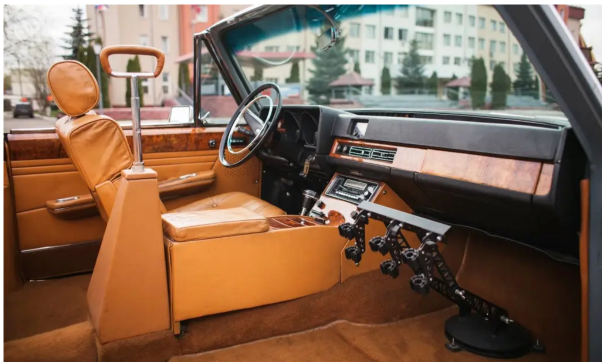
Pohled dovnitř vozu.

Kabriolet měl přitom jedinou funkci. Měl sloužit jako automobil na vojenských přehlídkách, hlavně na těch květnových, konaných na moskevském Rudém náměstí.