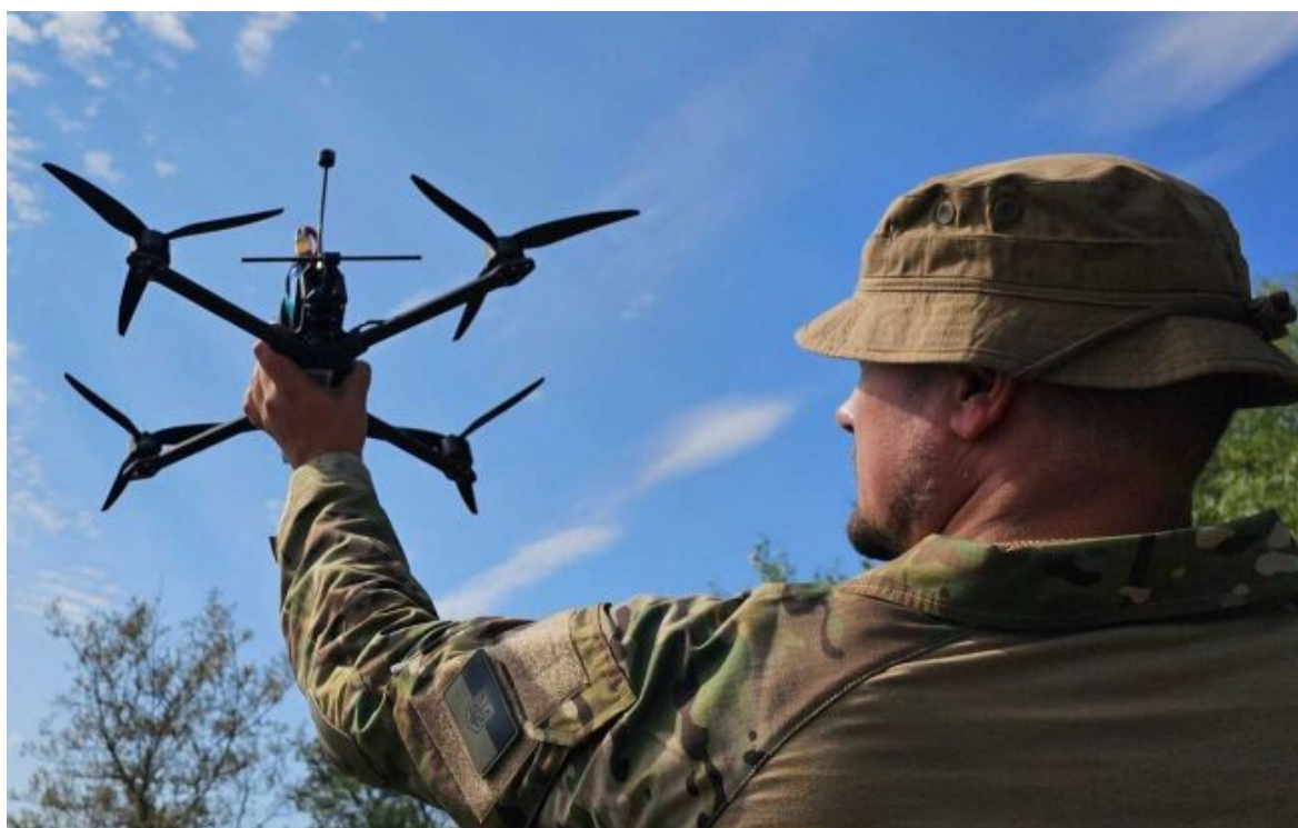
Foto: Ukrajina testovala drony s komunikací z optických vláken (facebook.com GeneralStaff.ua)