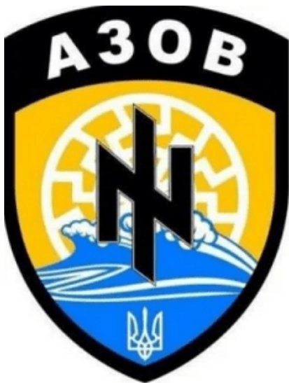
Emblem of the Azov Battalion formed by Kiev's junta.

Na první pohled si běžný občan zeměkoule může myslet, že vše, co se nyní děje na banderovské Ukrajině a kolem ní, včetně rekonstrukce mezinárodních vztahů a reformulací globálního řádu v politice, je zřejmě jen velké nedorozumění. Pro tytéž lidi pravděpodobně nemá neustálé rozšiřování NATO na východ od roku 1999, tedy směrem k Rusku, nic společného se snahou podmanit si a roztrhat Rusko, jak to chtěli stejně Napoleon (v roce 1812) i Hitler (v roce 1941).