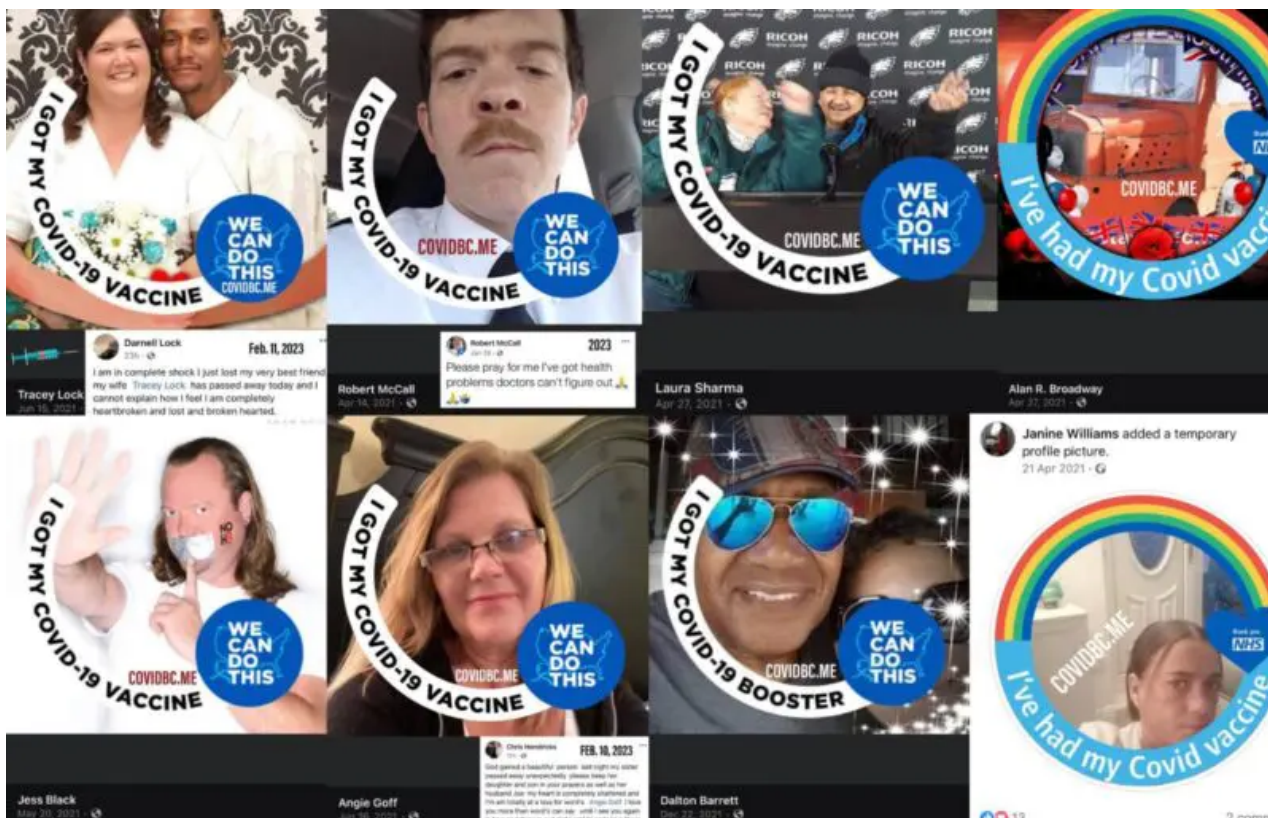
Toto je výběr z telegramového účtu za poslední TŘI dny.

A hlášení na SÚKL? Prokázat úmrtí v přímé souvislosti s očkováním? Možná, pokud člověk zemře přímo v očkovacím centru s injekcí v paži, tak věřím, že je tak 10% šance, že se to přičte skutečně očkování. Že by se prokázal zbytek, je čirá naivita.