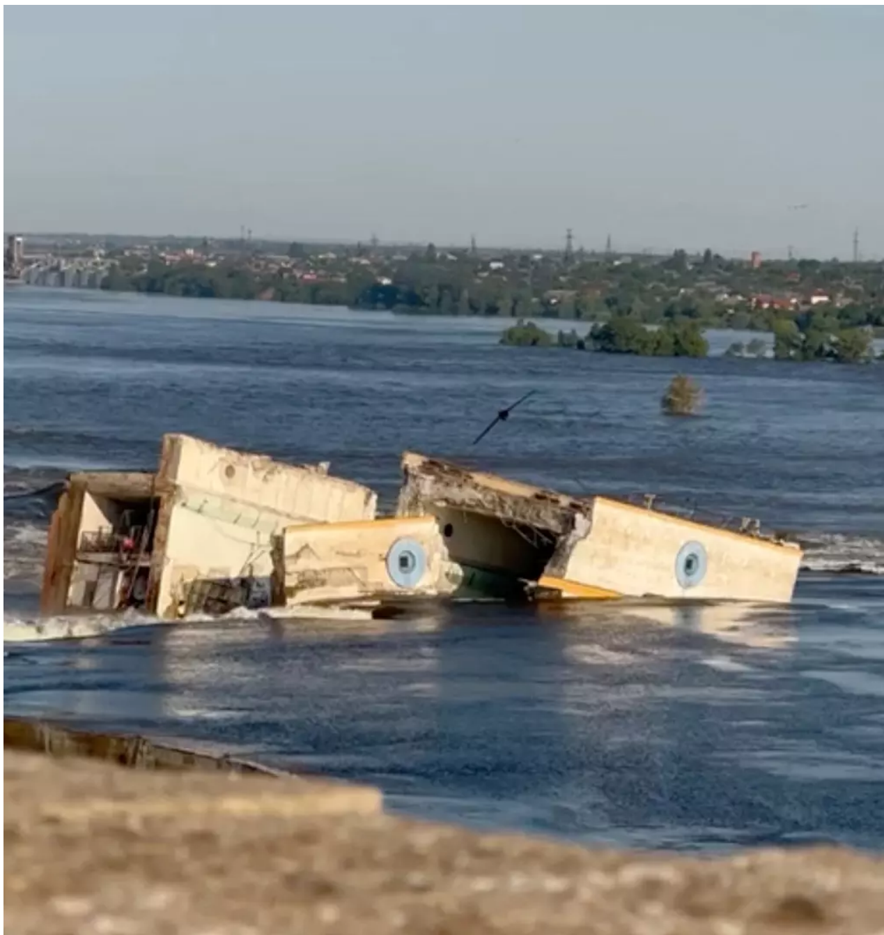
Protržená přehrada na jihu Ukrajiny rozpoutala záplavy

Podle Ilji Šumanova z ruské pobočky organizace Transparency International byl zákon přijat „právě včas“, mimo jiné také kvůli tomu, že zbavuje odpovědnosti lidi, kteří nyní rozhodují o reakci úřadů na okupovaných zaplavených územích.