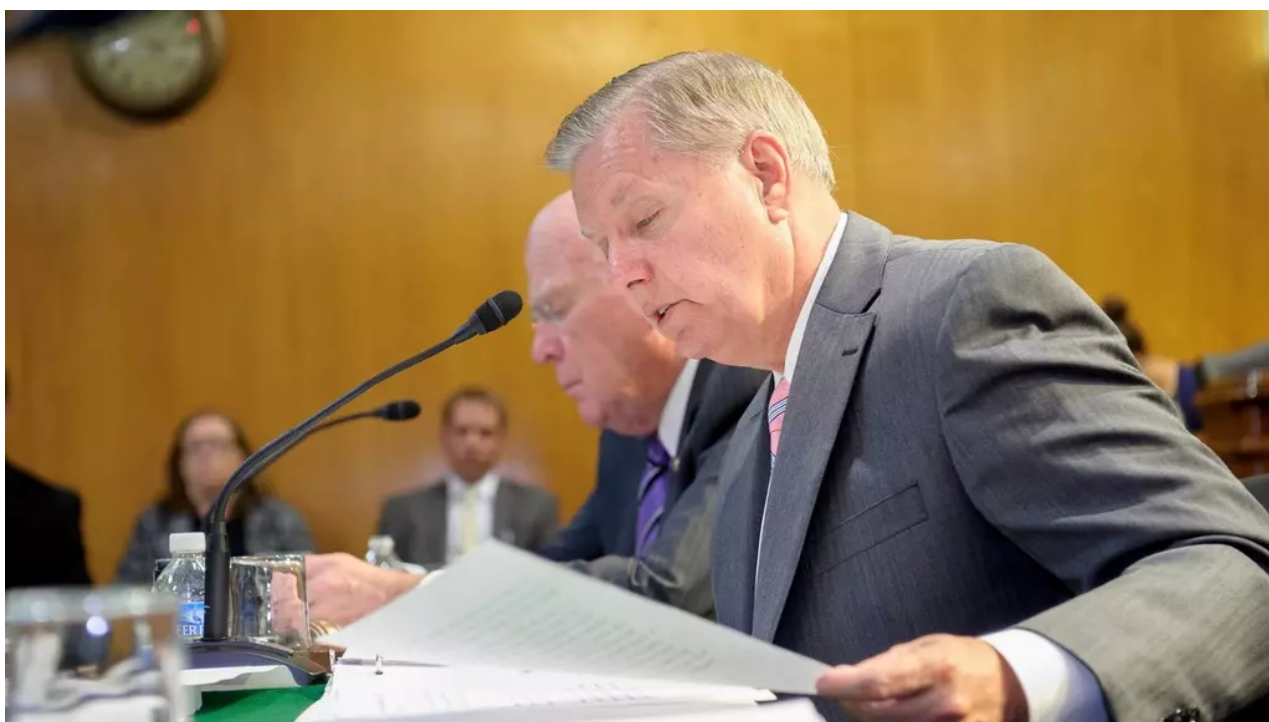
Lindsey Graham

Dva američtí senátoři (republikán Lindsey Graham a demokrat Richard Blumenthal) vypracovali návrh rezoluce, na jejímž základě by měly Spojené státy v případě použití jaderných zbraní Ruskem nebo jeho útoku na Záporožskou jadernou elektrárnu, který by vedl k úniku radiace, žádat aktivaci článku 5 smlouvy o kolektivní obraně NATO.