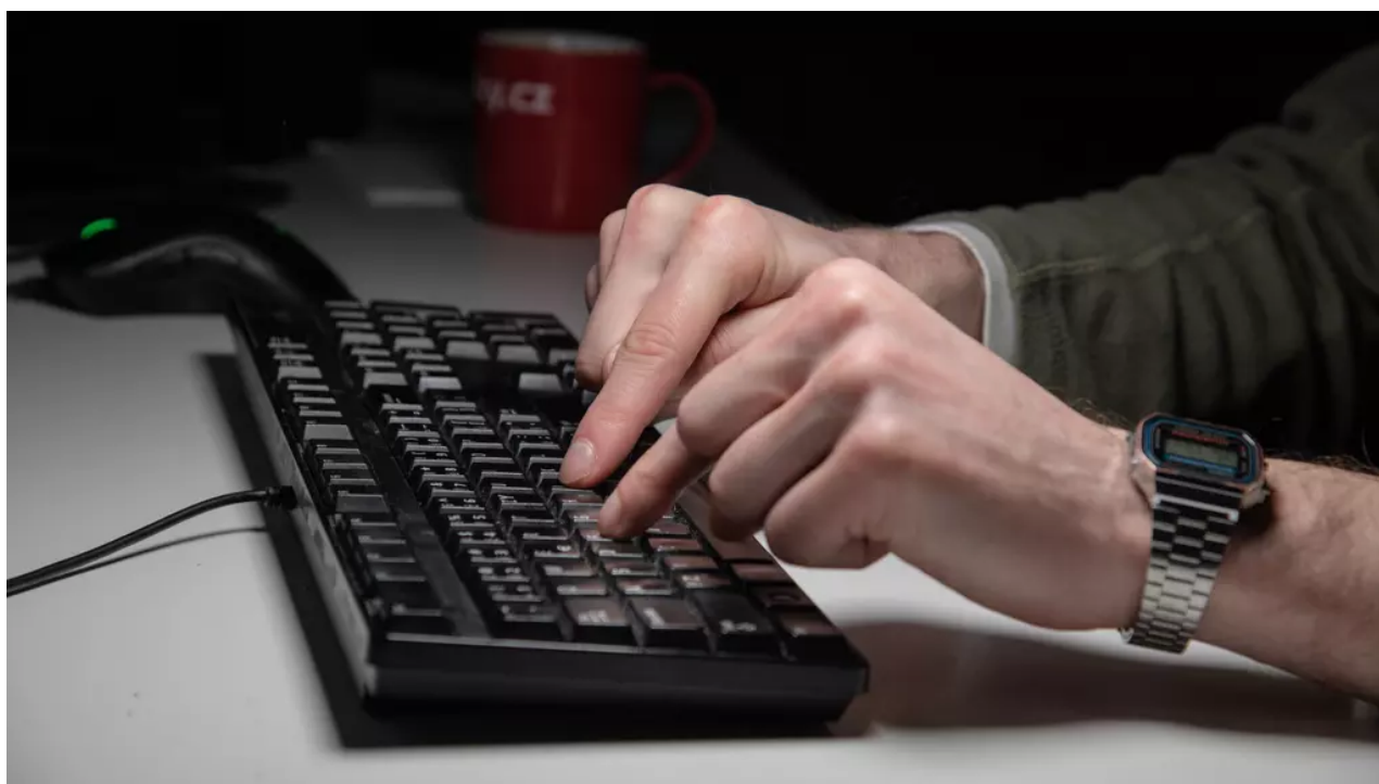
Ilustrační snímek

Vláda nedostatečně bojuje proti konspiracím a dezinformacím, domnívá se 63 procent Čechů. Naopak 18 procent veřejnosti považuje boj s dezinformacemi za dostatečný. Zbývajících 19 procent dotázaných to podle svých slov nedokáže posoudit. Vyplývá to z průzkumu společnosti Median pro Český rozhlas (ČRo). Konal se na konci června a zúčastnilo se ho 1000 lidí starších 18 let.